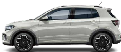
Ascot Grey アスコットグレー (6U)