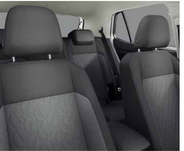
シート: メランジュグレー (QV)