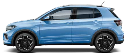
Clear Blue Metallic クリアブルーメタリック (R9)