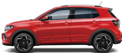
Kings Red Metallic キングズレッドメタリック (P8)*1