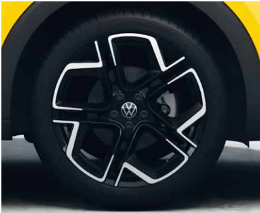
18インチアルミホイール