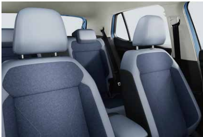
TSI Style コスミックブルー／チタンブラック (WG)