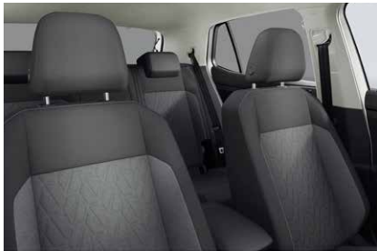
TSI Active メランジュグレー (QV)