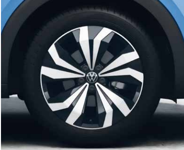
17インチアルミホイール