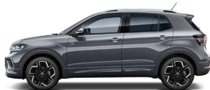
Smoky Grey Metallic スモーキーグレーメタリック (5W)