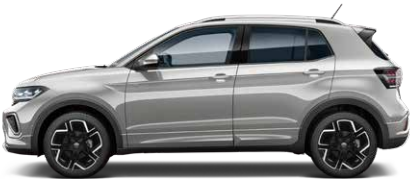
Reflex Silver Metallic リフレックスシルバーメタリック (8E)