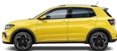
Grape Yellow グレーブイエロー (1C)