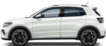
Pure White ピュアホワイト (0Q)