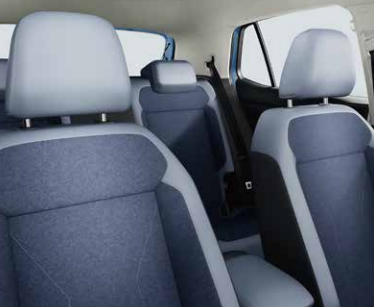
シート:コスミックブルー／チタンブラック(WG)