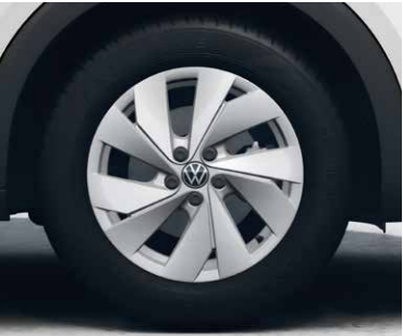
16インチアルミホイール