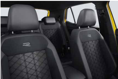
TSI R-Line グレー (WS)