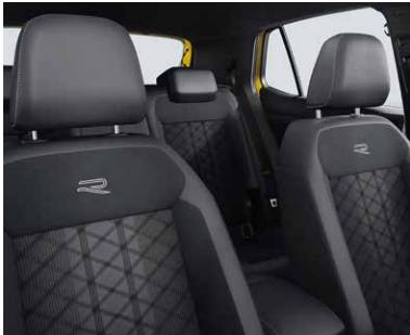
シート: グレー (WS)