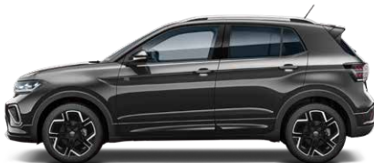
Deep Black Pearl Effect ディープブラックパールエフェクト (2T)