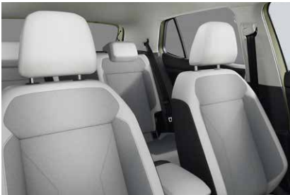
TSI Style Design Package ミストラル／チタンブラック (SV)*2