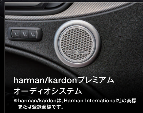
harman/kardonプレミアム オーディオシステム

※harman/kardonは、Harman International社の商標 または登録商標です。