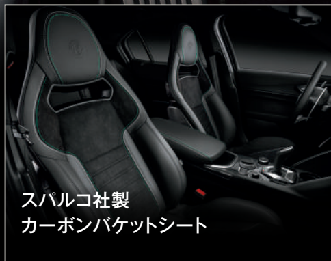
スパルコ社製 カーボンバケットシート

ステルヴィオ クアドリフォリオは、新たに採用された3D仕上げのカーボンファイバーで装飾され、レーシングマシンにインスパイアされた各種装備を備えています。ステアリングホイールには、アルミ製シフトパドルとコントロールスイッチが備わり、ドライバーとの高い一体感を実現。また、スパルコ社製カーボンバケットシートはカーボンファイバー・レザー・アルカンターラを使用し、最高レベルの快適さと、スポーツドライブに集中できるホールド性を提供します。