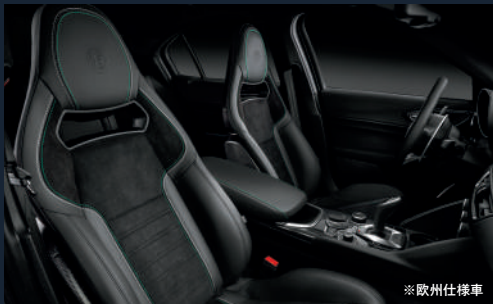
スパルコ社製 カーボンバケットシート