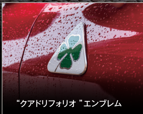
“クアドリフォリオ”エンブレム