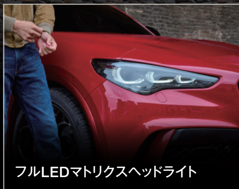
フルLEDマトリクスヘッドライト