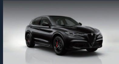
ブルカノ ブラック