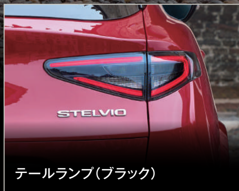
テールランプ(ブラック)