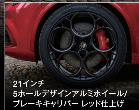
21インチ 5ホールデザインアルミホイール/ ブレーキキャリパー レッド仕上げ

※掲載の写真は欧州仕様車です。一部日本仕様と異なる場合があります。※日本仕様車は右ハンドルとなります。