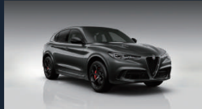
ヴェズヴィオ グレー