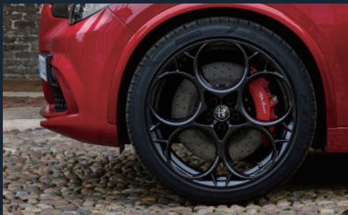
21インチ 5ホールデザイン アルミホイール