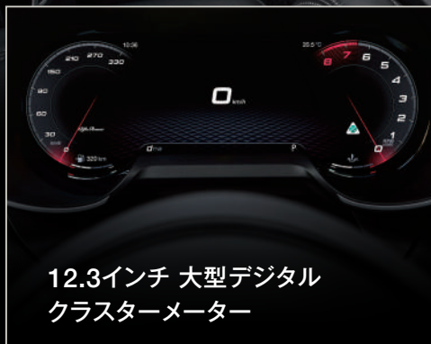
12.3インチ 大型デジタル クラスターメーター