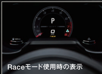
Raceモード使用時の表示

トラクションコントロールの介入は限定的となり、ステアリング、アダプティブクルーズコントロール、ブレーキ、サスペンションがサーキット対応の設定に。合わせて、エキゾーストシステムはさらにダイナミックな設定となり、轟くサウンドとともに、究極のドライビングエクスペリエンスを実現します。