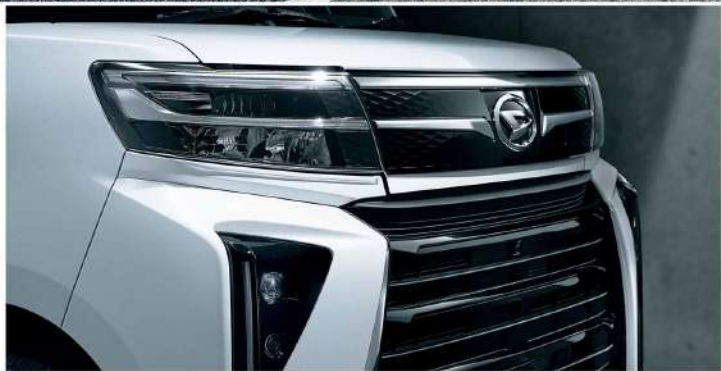
Photo:カスタムRS 2WD, デディカラーのプラッタマイカメタリック (387) + ソンイエンジヤウイトバーン (020) [200], サイドガーニッシュ (メッキ), スマートキーズ・バック, トンズスマの造像デイスプレィオーディオ (スマートナビ/ラマリーキングナビ付), 運転席ロングスライドシート (3.40 ton/シートバックレナード) はメーカーオプション。