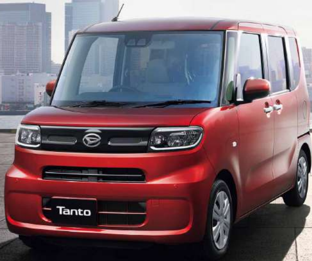
Photo: © 2010, 2011 Daihatsu. All rights reserved. Daihatsu is a registered trademark of Daihatsu Motor Co., Ltd.