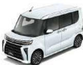
シャイニングホワイトパール(NP25)※1