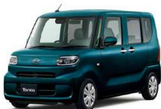
駆動方式 トランスミッション メーカー希望小売価格 2WD CVT 1,485,000円(消費税抜き1,350,000円) 4WD CVT 1,611,500円(消費税抜き1,465,000円)