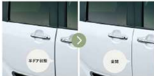
スライドドアイージークローザー(左右)

半ドアから自動で全閉するイージークローザー機能を左右のスライドドアに搭載。パワースライドドア装着の有無にかかわらず、少しの力でドアを簡単に閉められます。