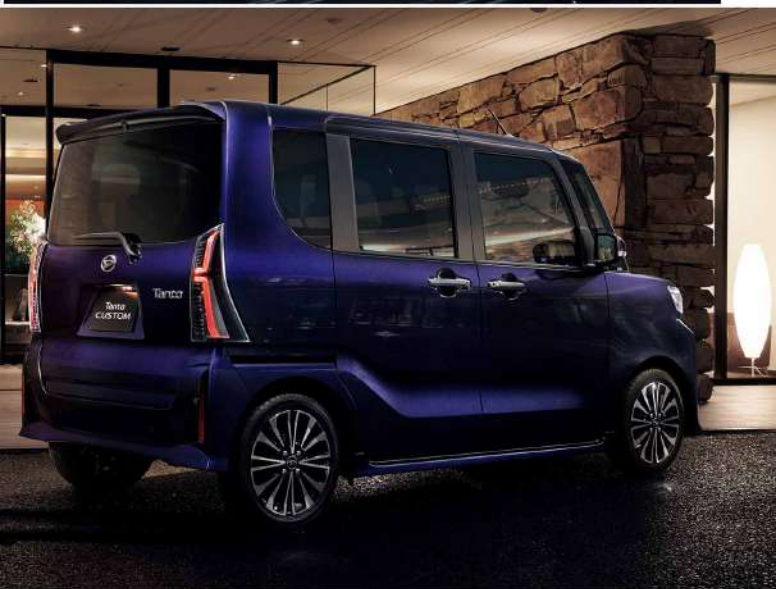
Photo: カスチム RS 2WD, サビカラーのターボバイセレクト3リッターSバルブエンジン(2000cc), スマートブレーキシステム3リッターインテグリティディスプレイオーディオ(スマートナビ/マルチキリンディスプレイ付), 鋼製ロングスライドライト(4kg)シートバックレバー付はメーカーオプション。 ■鋼製ロングスライドライトは、シートポジションが「P」の時のみ使用できます。