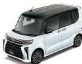
ブラックマイカメタリック(X07)× シャイニングホワイトパール(NP25) [R03]※2