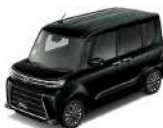
ブラックマイカメタリック(X07)