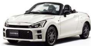
Photo:GR SPORT,7速スーパーアクティブシフト付CVT車。 ボディカラー:パールメタリック(白)2416mm×カーブアッシュで22,000円高(別途税別)。