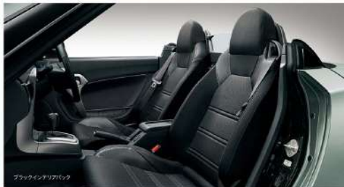
ブラックインテリアパック