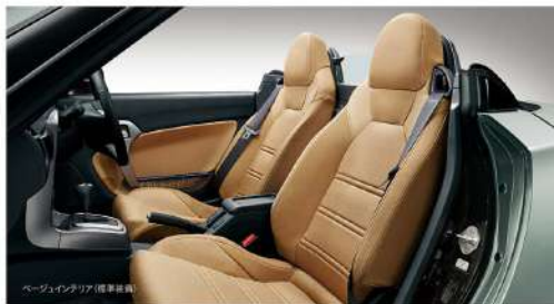
ベージュインテリア(標準装備)