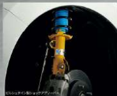
ビルシュタイン製ショックアブソーバー

その走りには、コーナリング中のロールを抑えてタイヤのグリップを最大限に引き出すことが可能。これにより一段と高い速度域でもサスペンションがしっかりと粘り、優れた操縦安定性を実現します。とりわけワインディングを愉しめるサーキットを攻める。タイヤがしっかりと路面をとらえるグライドなコントロールフィールとともにアクセルワークを積極的に使ったスポーツドライビングを堪能してください。