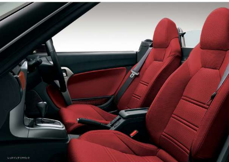
レッドインテリアパック