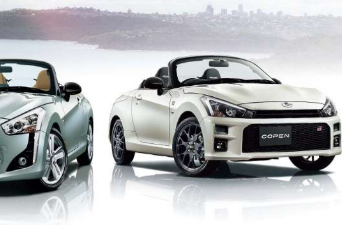
Photo: (左) Cero, ボディカラーはブリリアッシュグリーンマイカ(537), レンティンアソビバック装着車。右の型番は16インチアルミホイールはメーカーオプション。(中) Robe, 16インチアルミホイール(Race/Cero特アサイン)装着車。ボディカラーはリベロメタリック(538)はメーカーオプション。(右) GR SPORT, ボディカラーはパールホワイト(524)はメーカーオプション。