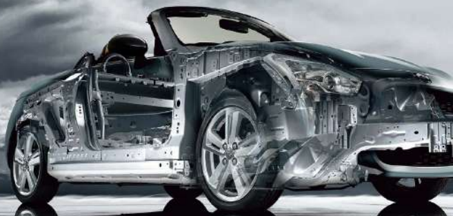
■写真イメージです。