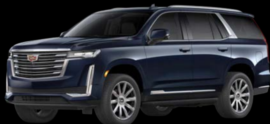
ダークムーンブルーメタリック