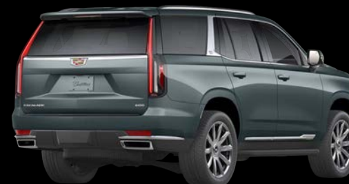
サイプレスメタリック