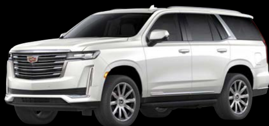
クリスタルホワイトトリコート