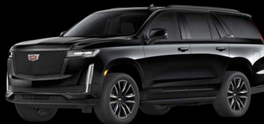
セーブルブラック