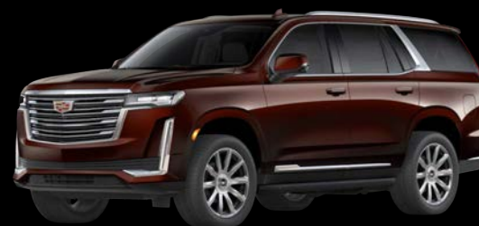
マホガニーメタリック