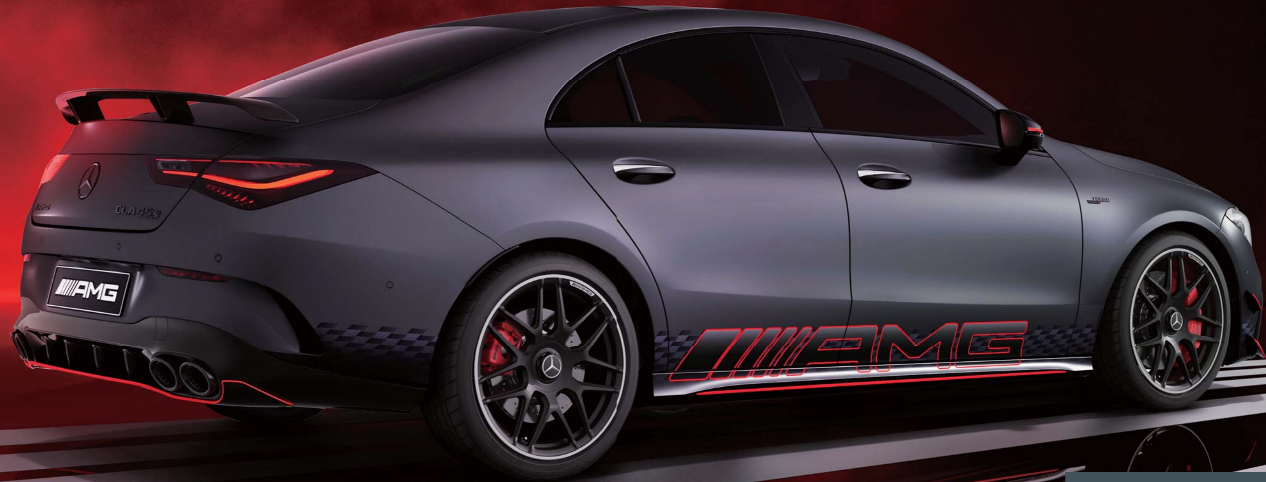
Mercedes-AMG CLA 45 S 4MATIC+ Street Style Edition