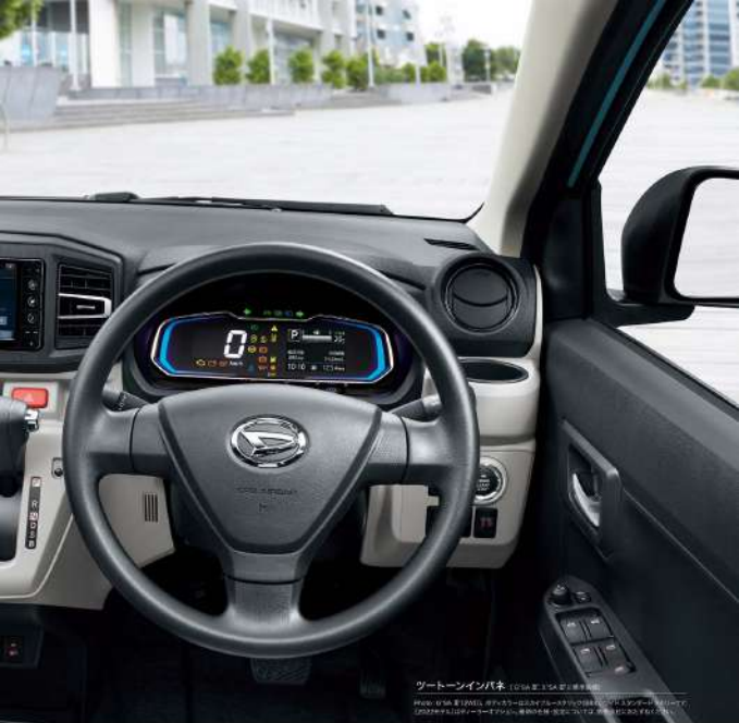
ツートーンインパネ (L15A型・L15A型) 標準装備

※L15A型・L15A型は2WD、4WDタイプはオプションで装着可能。L15A型は標準装備。L15A型は2WDタイプは標準装備。L15A型は2WDタイプは標準装備。L15A型は2WDタイプは標準装備。