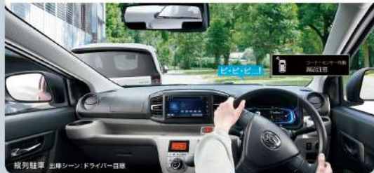
縦列駐車 出庫シーン*ドライバー目線