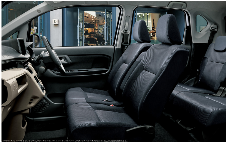
Photo: X'リミテッド II SA 車 2 WD、ボディカラーのシャイニングホワイトパール(W26)はメーカーオプションで、22,000円(消費税込み)。