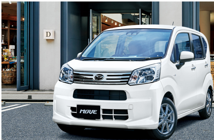
Photo: X'リミテッド II SA 車 2 WD、ボディカラーのシャイニングホワイトパール(W26)はメーカーオプションで、22,000円(消費税込み)。