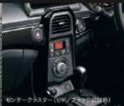
センタークラスター (シフトノブ付)