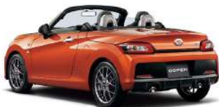
Photo:GR SPORT,7速スーパーアクティブシフト機構CVT車、ボディカラーレッドコロムビア(赤)222,000円(消費税別)