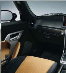
Photo: Robe エアスポーツ・アライアメントがCVT車、レーシングブリックル付車種。 ※レカロシートは3色のカラーコーディネートが可能です。ただし、黄色は、メーカーが「DRIVE PLATE」をデザインしています。 ※MOMO製本革巻ステアリングホイールは標準装備です。ただし、オプションでブラックのホイールも選べます。 ※LAYはブラックインテリアが標準装備ですが、パッケージによってレイアウトが異なる場合があります。