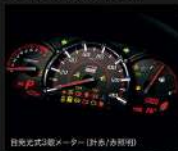
白発光式3速メーター (針赤/赤照明)