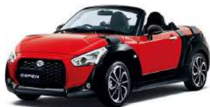
Photo: XPLAY 3, 7速スーパーアクティブシフトH CVT車, ブラックインテリアバック, 16インチアルミホイール (XPLAY専用デザイン) 装着車。 BDS装着車 (16インチアルミホイール) 装着車 (メーカーオプション ¥202,400円 (消費税別)) 装着車。