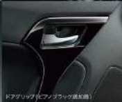
ドアグリップ (ピアノブラック調加飾)

■写真は掲載車種の色と異なり実際とは多少異なる場合があります。■「RIDE」インテリアは必ずしも全車に標準、メーカーオプションの純正アクセサリーは必ずしも全車に標準ではありません。■「RPLAY S」インテリアは必ずしも全車に標準、メーカーオプションの純正アクセサリーは必ずしも全車に標準ではありません。■「Cero D」インテリアは必ずしも全車に標準、メーカーオプションの純正アクセサリーは必ずしも全車に標準ではありません。■「GR SPORT」インテリアは必ずしも全車に標準、メーカーオプションの純正アクセサリーは必ずしも全車に標準ではありません。■写真は掲載車種の色と異なり実際とは多少異なる場合があります。■写真は掲載車種の色と異なり実際とは多少異なる場合があります。