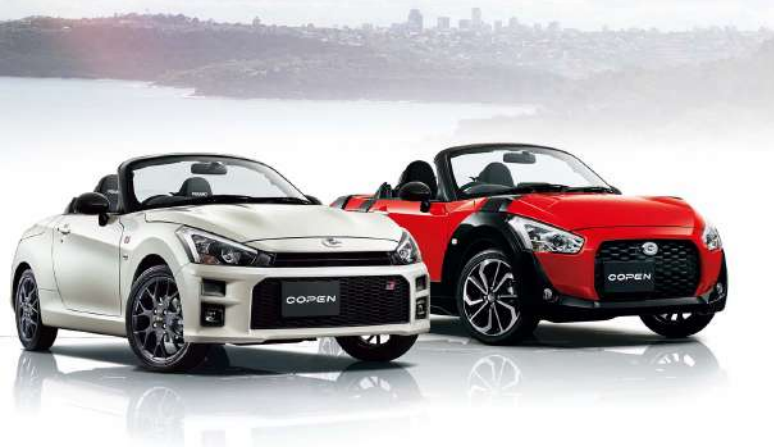
Photo: [注]Cero、ボディカラーは7アッシュグリーン・マイカ(07)、レッドインテグリアブラック装着車、9500000円(16インチアルミホイールはメーカーオプション、09年)Robe、ボディカラーはインテグリアブラック、19インチアルミホイール装着車、ボディカラーはインテグリアブラック(05)9500000円(メーカーオプション、09年)GR SPORT、ボディカラーはパールホワイト(04)9240000円(メーカーオプション、15年)XPLAY、ブラックインテグリアブラック、18インチアルミホイールDPLAT装着車、ボディカラーはセトール・レッドパール・R7D(メーカーオプション、