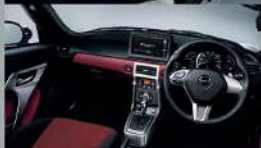
Photo RPLAY Sは、スポーツシート (シロシート) 付CVT車、ブラックのインテリアの標準車、メッキエアクンシジスターストブ、メッキパーキングブレーキボタン、メッキインテアドアハンドル (バリエーション付) のインテリアです。

Photo Cero Sは、スポーツシート (シロシート) 付標準車、レッドアクセントのインテリアの標準車、メッキエアクンシジスターストブ、メッキパーキングブレーキボタン、メッキインテアドアハンドル (バリエーション付) のインテリアです。