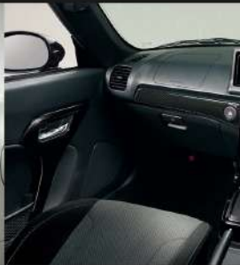
Photo: GR SPORT、7速マニュアルミッション付CVT車、メーカーのグレード別オプションはメーカーオプション。 ※GRは、メーカーが「DRIVE PLATE」をデザインしています。