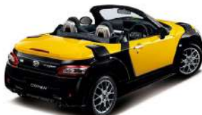
Photo: XPLAY S, 7速スーパーアクティブシフトH CVT車, ブラックインテリアバック装着車。 BDS装着車 (16インチアルミホイール) 装着車 (メーカーオプション ¥202,400円 (消費税別)) 装着車。