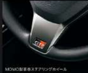
MOMO製本革巻ステアリングホイール