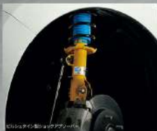
ビルシュタイン製ショックアブソーバー

その走りは、コーナリング中のロールを抑えてタイヤのグリップを最大限に引き出すことが可能。これにより一段と高い速度域でもサスペンションがしっかりと粘り、優れた操縦安定性を実現します。ときにはワインディングを楽しむ、サーキットを攻める。タイヤがしっかりと路面をとらえるグライドなコントロールフィールとともにアクセルワークを積極的に使ったスポーツドライビングを堪能してください。