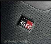
シロシート (スエード調)