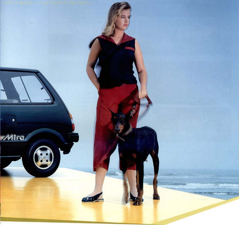
フルタイム4WDのミラSタイプは、4WDの楽しさを体験できる。フルオートマチックも用意。

上品でくわいスポーツマインド、からやかなフットワークを愛した、ミラSタイプ新登場。シフトチェンジの楽しさを実感できる5速ミッション、 快適と静粛性はさらに向上した。スポーティ感溢れるイージードライビングをという人々のためには、フルオートマチックも用意。 1.6L16Vエンジンには、オートイコイコカハールとシフトレス、足元を創める、145SR10スチールラジアルタイヤとブースター付ディスクブレーキ、 1.6L16Vエンジンを搭載した、スライディングウィンドウがA級だった。 どのクルマもその個性を十分に表現し、サクラ