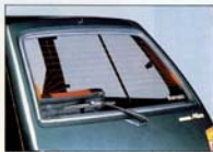
リヤウインドデフォグガーとリヤワイパー MAKER OPTION リヤウインドの曇りを一 掃するリヤウインドデフォグガー (リヤウインドデフォグガーは 高や雲の日の遠方視界を確保するリヤワイ パー (リヤウインドデフォグガーはオプション) 。]