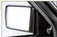
ドアミラー 遠方確認を容易にするワイドな 鏡面面積。ミラのシェアーはフォルムにマッチ したデザイン。