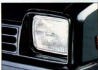
ハロゲンヘッドランプ OPTION より明る く、より遠くまで照らし、夜間走行の安全性を 高める。対向車への配慮も十全。