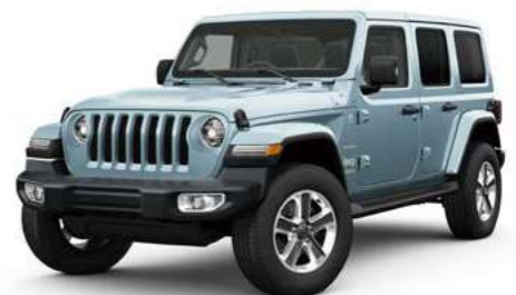
6 アール C/C