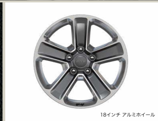
18インチ アルミホイール