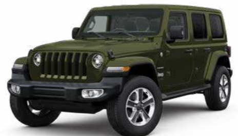
5 サージグリーン C/C