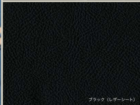
ブラック（レザーシート）