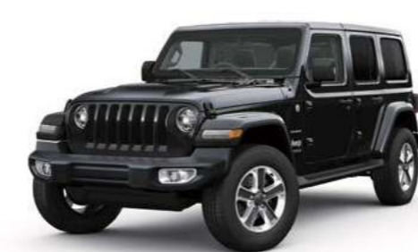
1 ブラック C/C