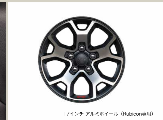
17インチ アルミホイール（Rubicon専用）