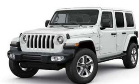
2 ブライトホワイト C/C