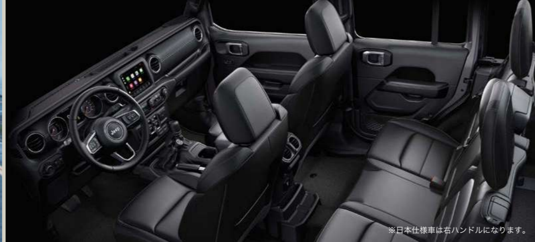
※日本仕様車は右ハンドルになります。