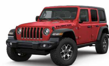
3 ファイヤークラッカーレッド C/C