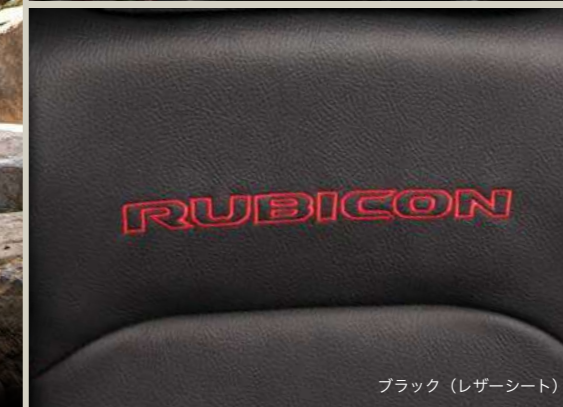
ブラック（レザーシート）