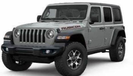
4 スティンググレー C/C