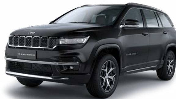
3. ブリリアントブラッククリスタル P/C