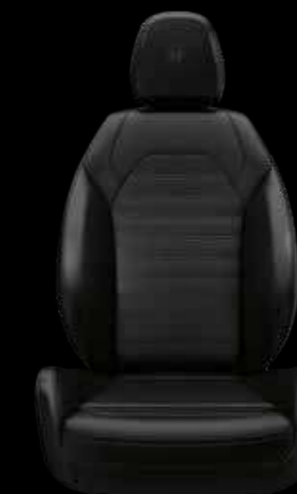
スポーツレザーシート (ブラック)