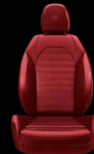
スポーツレザーシート (レッド)