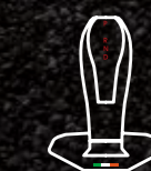
革巻きのシフトレバー

操作性の高さだけでなく、見た目の美しさを兼ね備えた、革巻きのシフトレバーを採用。その豊かな質感で、快適なシフトチェンジを約束する。