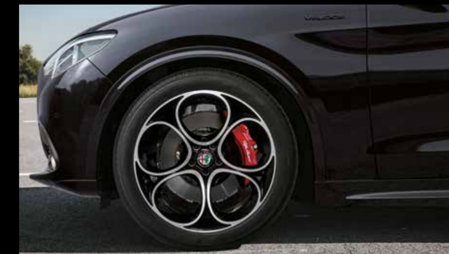
20インチ 5ホールデザイン アルミホイール