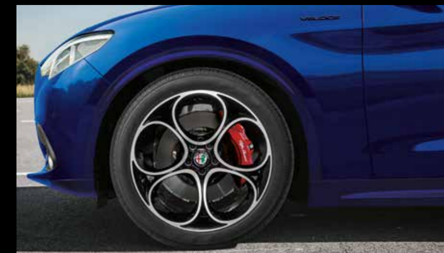
20インチ 5ホールデザイン アルミホイール