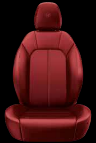
ナチュラルレザーシート (レッド)