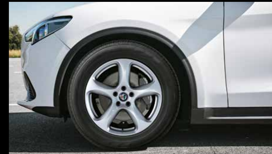
18インチ 5スポークデザイン アルミホイール