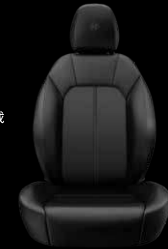
ナチュラルレザーシート (ブラック)