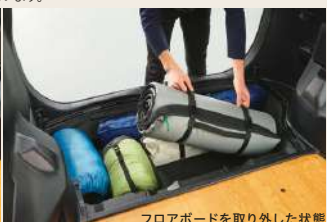
フロアボードを取り外した状態

ラゲージの床下に大容量の収納スペースを確保。荷物の出し入れがしやすいよう、フロアボードは 取り外し可能な左右2分割タイプを採用しています。 幅：約1,200mm（最大） 深さ：約210mm 奥行：約570mm