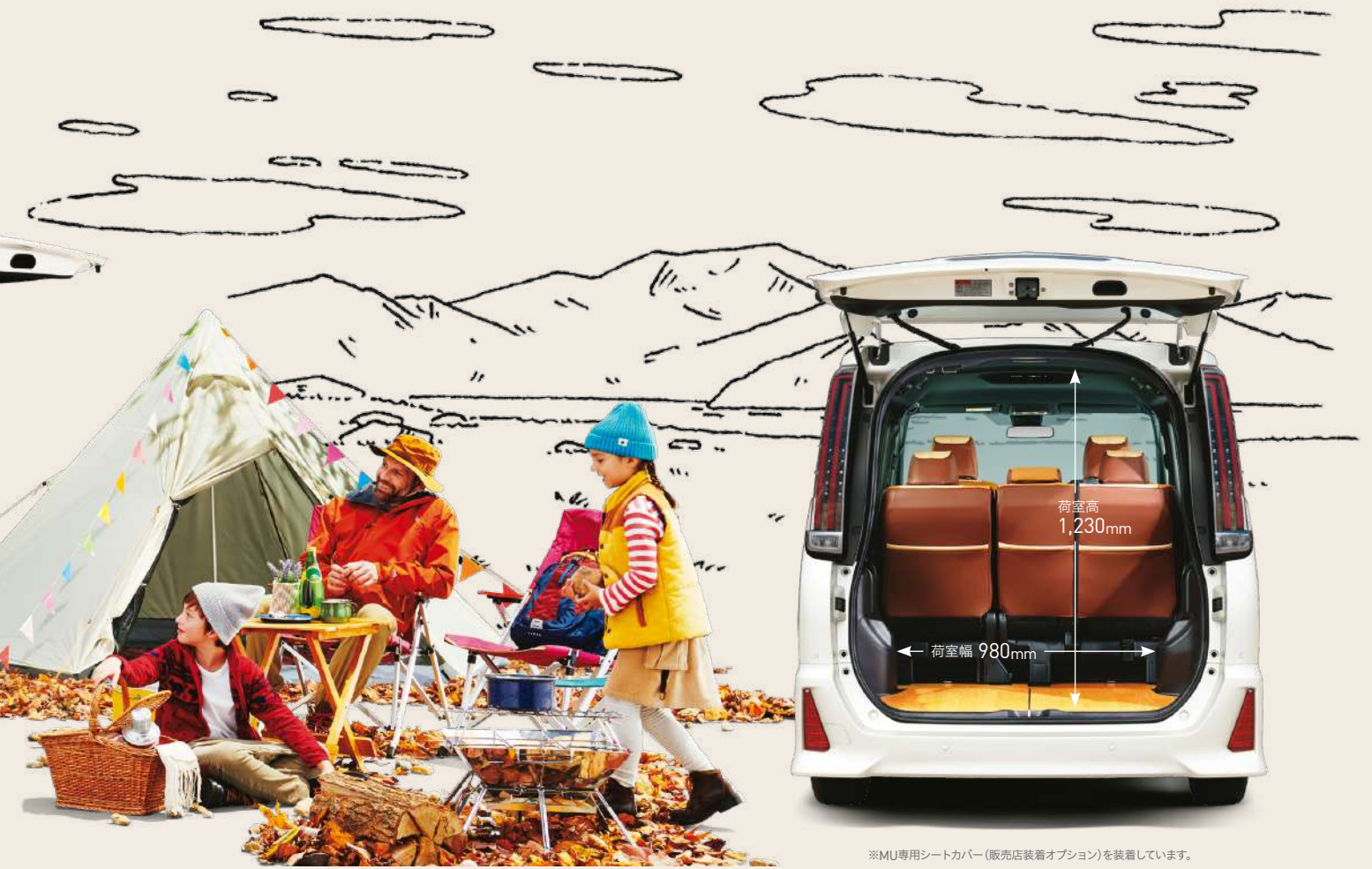
※MU専用シートカバー（販売店装着オプション）を装着しています。