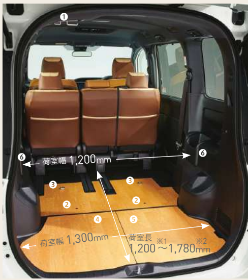
※1.セカンドシートを最後部までスライドさせた状態 ※2.セカンドシートチップアップ状態 ※MU専用シートカバー（販売店装着オプション）を装着しています。

2列シートだから叶う、 自由自在に使える大容量ラゲージが、 ふだんを便利に、週末を楽しく変えてくれる。 MUなら、あなたのライフスタイルが もっと広がる！