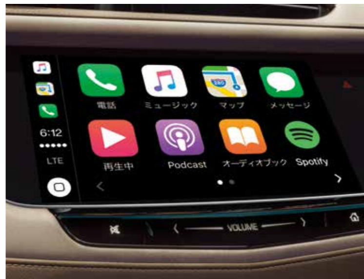
Apple CarPlay 使用時