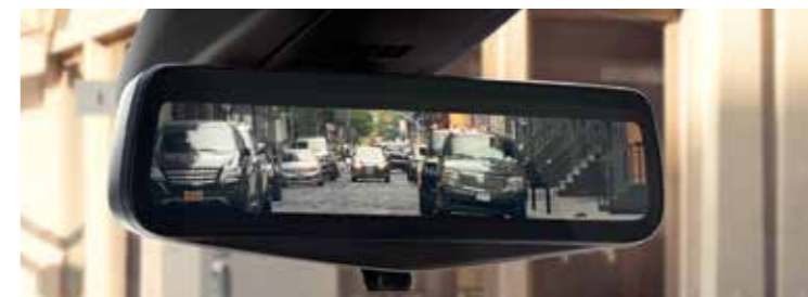
リアカメラミラー起動時