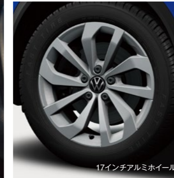
17インチアルミホイール