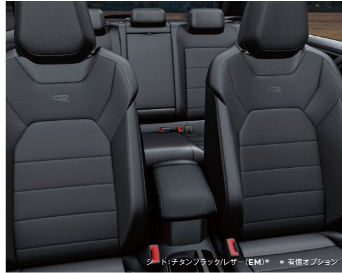
シート: チタンブラック/レザー (EM)* * 有償オプション