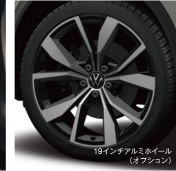
19インチアルミホイール (オプション)