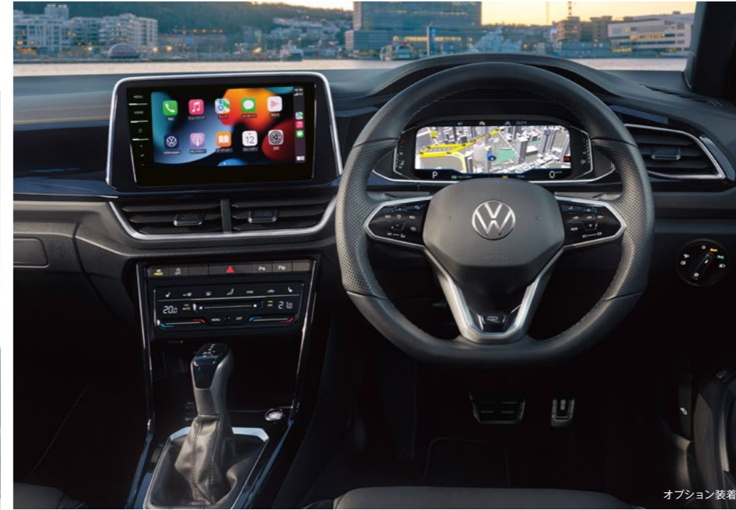
オプション装着車