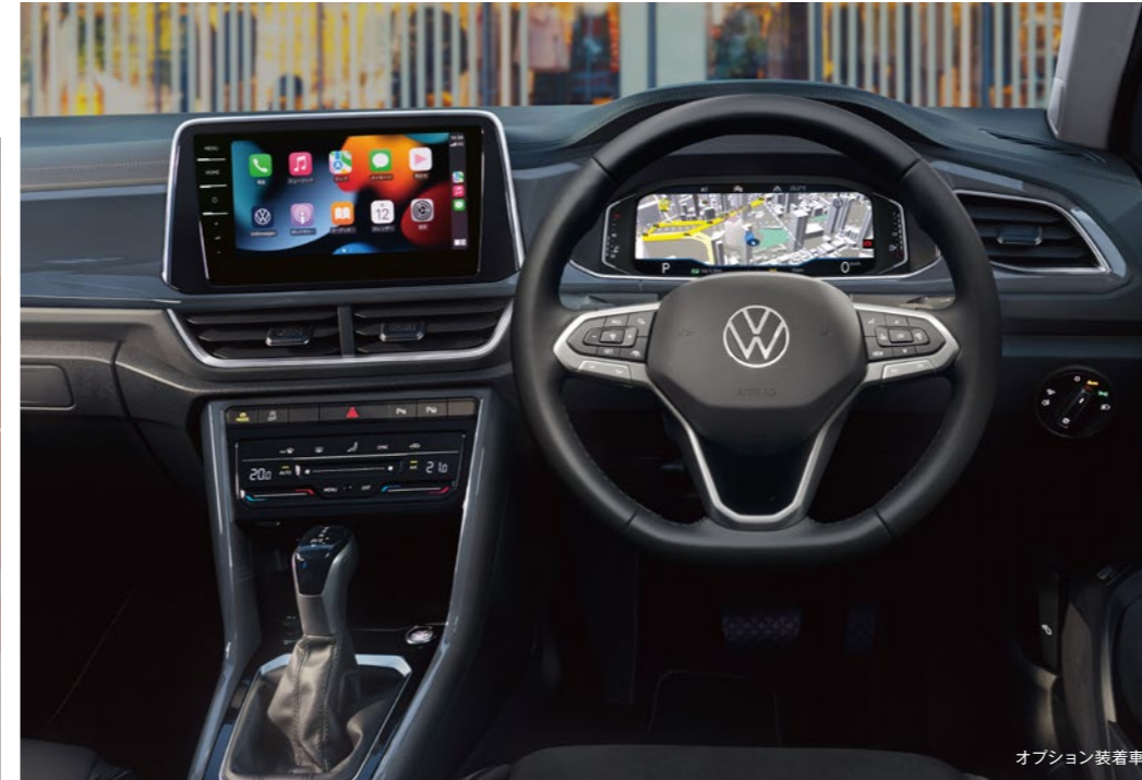
オプション装着車