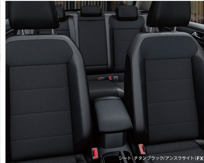
シート：チタンブラックアンスラサイト(FX)