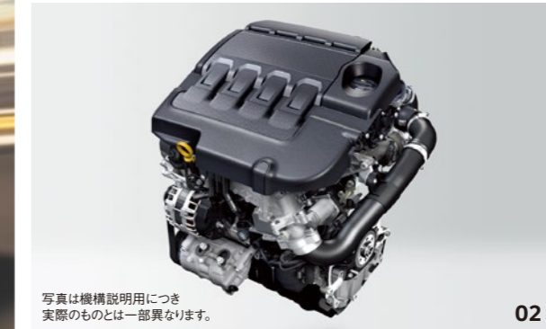
写真は機構説明用につき 実際のものとは一部異なります。