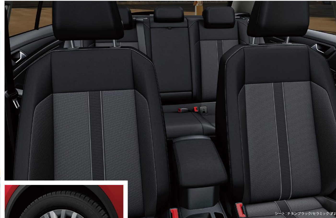
シート：チタンブラック/セラミック (FJ)