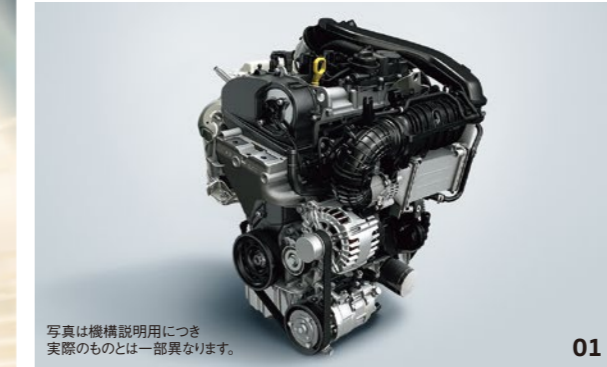
写真は機構説明用につき 実際のものとは一部異なります。

見た目の期待を裏切らない、ダイナミックで爽快なパフォーマンス。T-Rocは力強い1.5ℓ TSI®エンジンと、ロングドライブも得意なクリーンディーゼルの2.0ℓ TDI®エンジンをラインアップ。7速DSG®などのテクノロジーと相まって、気持ちのいい加速やクルマとひとつになる高速安定性を楽しめます。