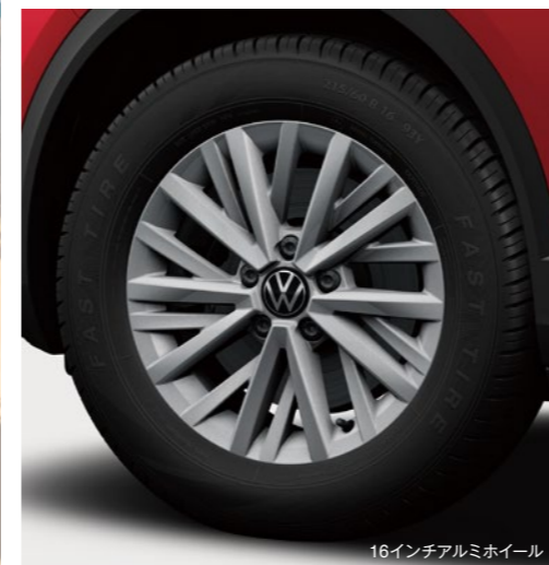
16インチアルミホイール