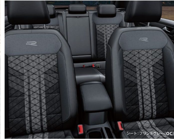
シート: フリントグレー (OC)