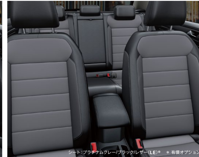
シート：プラチナムグレー/ブラックレザー(LE)* * 有償オプション