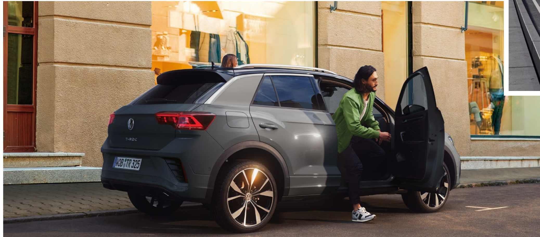
Photo: TDI R-Line ボディカラー:インジウムグレーメタリック(X3)/ブラックルーフ オプション装着車 写真は一部実際と異なります。

動画は自動再生されますが、見たい動画を画面上のプレイリストから選択することもできます。 ※動画に登場するモデルはT-Rocとは異なりますが機能は同様です。