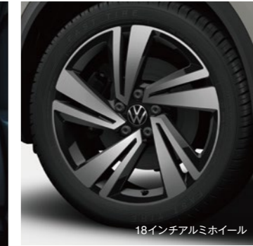
18インチアルミホイール