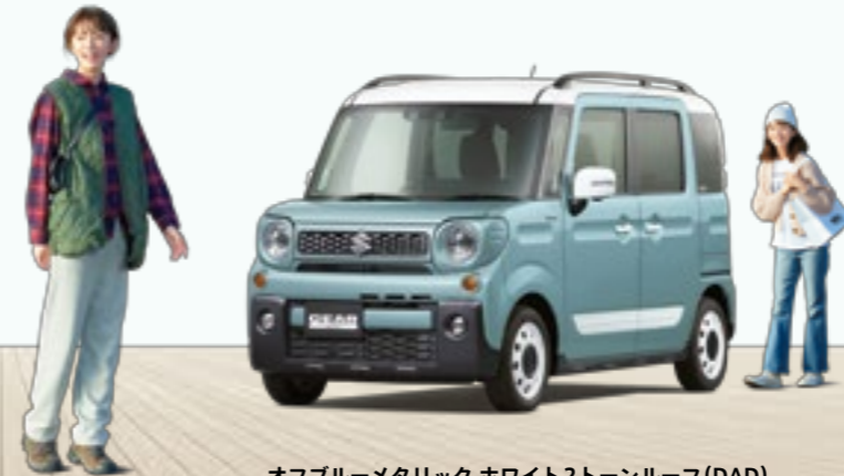
オフブルーメタリック ホワイト2トーンルーフ(DAD)