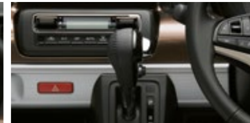
■本革巻シフトノブ[メッキシフトノブボタン]