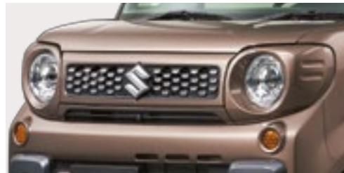
■ヘッドランプガーニッシュ[車体色] ■フロントグリル[車体色&メッキ]