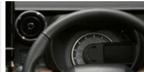
■スピードメーターリング[シルバー] ■メッキエアコンルーバー[風量調整機能付]