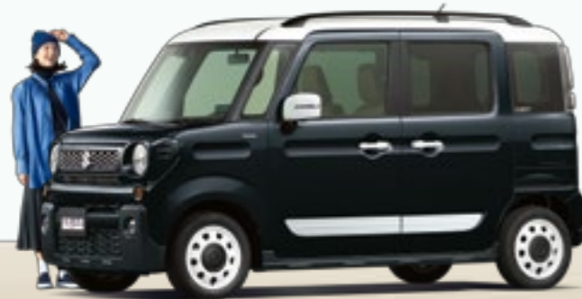
ブルーイッシュブラックパール3 ホワイト2トーンルーフ(LM2)