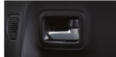
■メッキインサイドドアハンドル