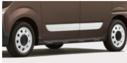
■専用14インチアルミホイール[ホワイト][ガンメタリックハーフホイールキャップ付] ■サイドドアガーニッシュ[ホワイト]