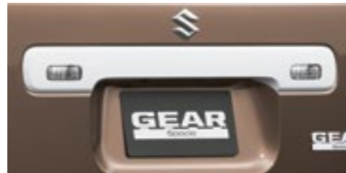
■バックドアガーニッシュ[ホワイト]