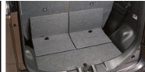
■ラゲッジフロア[ファブリック]