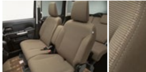
■ファブリックシート表皮[ライトブラウン][ホワイトステッチ]