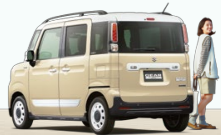
シフォンアイボリーメタリック ホワイト2トーンルーフ(2BR)