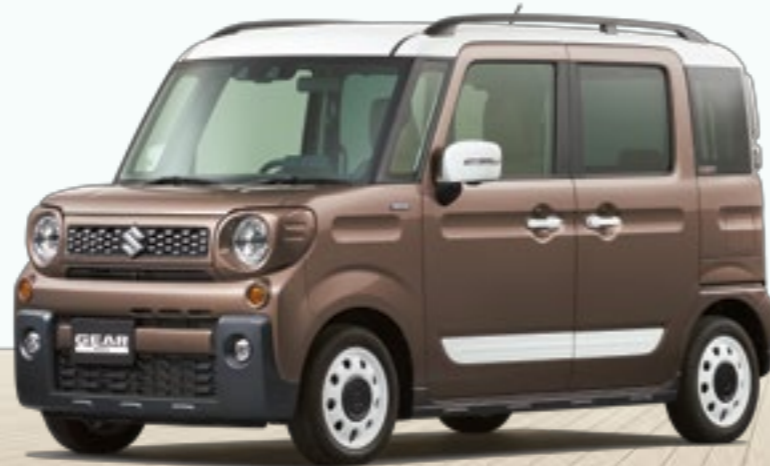
ウディブラウンメタリック ホワイト2トーンルーフ(ESB)