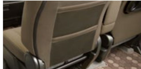
■助手席シートバックポケット[2段、メッシュタイプ][ブラウン]