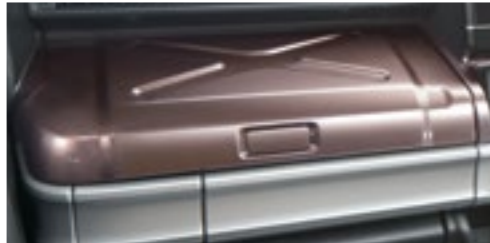
■インパネカラーパネル[ブラウン]