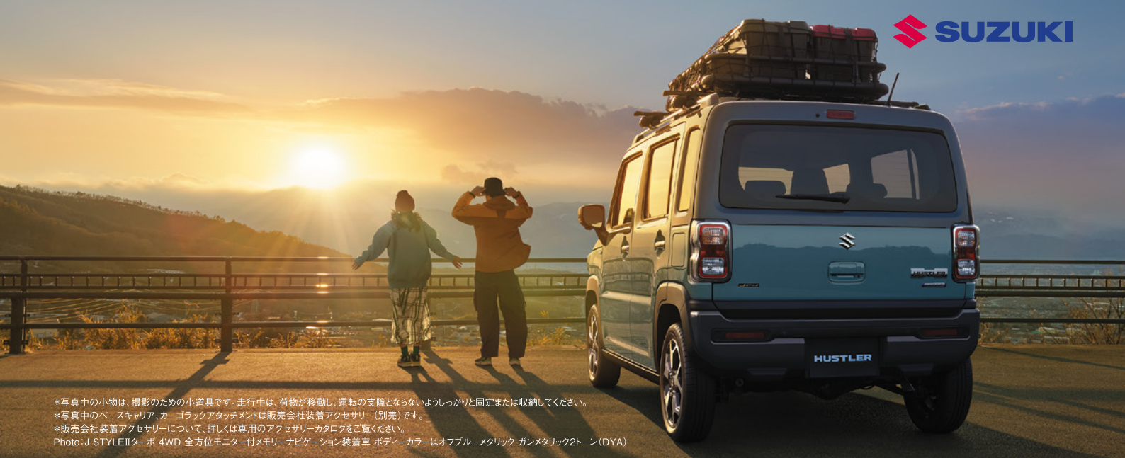
*写真中の小物は、撮影のための小道具です。走行中は、荷物が移動し、運転の支障とならないようしっかりと固定または収納してください。 *写真中のベースキャリア、カーゴックアタッチメントは販売会社装着アクセサリ（別売）です。 *販売会社装着アクセサリについて、詳しくは専用のアクセサリカタログをご覧ください。 Photo: J STYLEIIターボ 4WD 全方位モニター付メモリーナビゲーション装着車 ボディーカラーはオフブルーメタリック ガンメタリック2トーン(DYA)