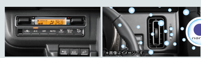
■「ナノイー X」*搭載フルオートエアコン[エアフィルター付]

日焼けの原因となるUV(紫外線)を約99%カット。さらに、ジリジリとした暑さのもとであるIR(赤外線)もカットする特殊なガラスを全面に採用し、強い日射しからお肌を守ります。