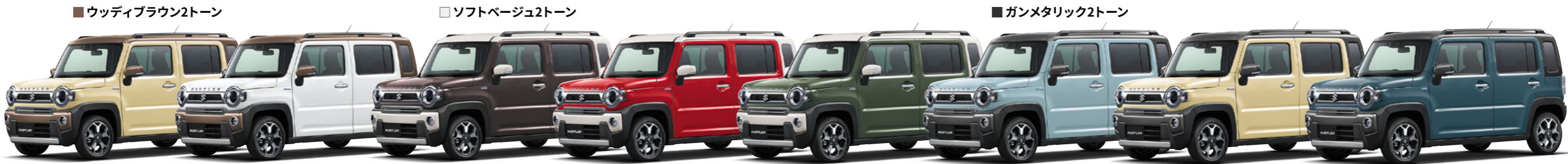
■ ウッディブラウン2トーン ■ ソフトベージュ2トーン ■ ガンメタリック2トーン シフォンアイボリーメタリック ウッディブラウン2トーン(DZR) 特別設定色 ピュアホワイトパール ウッディブラウン2トーン(DZW) 特別設定色 アーバンブラウンパールメタリック ソフトベージュ2トーン(ESA) 特別設定色 フェニックスレッドパール ソフトベージュ2トーン(ER8) 特別設定色 クールカーキパールメタリック ソフトベージュ2トーン(ER6) オフブルーメタリック ガンメタリック2トーン(DYA) 特別設定色 シフォンアイボリーメタリック ガンメタリック2トーン(D4L) 特別設定色 デニムブルーメタリック ガンメタリック2トーン(D4E)