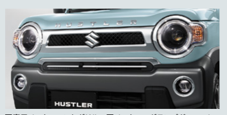
■専用メッキフロントグリル ■メッキフォグランプガーニッシュ ■HUSTLERアルファベットエンブレム[メッキ] (フロントフード)

*写真中のフロアマットは販売会社装着アクセサリ(別売)です。 *販売会社装着アクセサリについて、詳しくは専用のアクセサリカタログをご覧ください。 Photo: J STYLE IIターボ 4WD 全方位モニター付メモリーナビゲーション装着車 ボディカラーはオフブルーメタリック ガンメタリック2トーン(DYA)