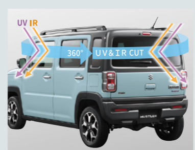
■360°プレミアムUV&IRカットガラス 360°日射し対策もバッチリです。