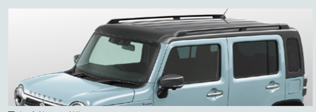
■メッキドアハンドル ■ルーフレール