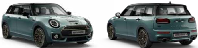
■ ボディー・カラー セージ・グリーン(掲載画像) / ■ ボディー・カラー ミッドナイト・ブラックII ■ ボディー・カラー・ルーフ&ミラー・キャップ / ■ ブラック・ルーフ&ミラー・キャップ(掲載画像)*1

メーカー希望小売価格(税込) | COOPER S CLUBMAN : ¥5,320,000