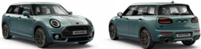
■ ボディー・カラー セージ・グリーン(掲載画像) / ■ ボディー・カラー ミッドナイト・ブラックII ■ ボディー・カラー・ルーフ&ミラー・キャップ(掲載画像) / ■ ブラック・ルーフ&ミラー・キャップ*1

メーカー希望小売価格(税込) | COOPER CLUBMAN : ¥4,830,000