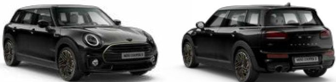
■ ボディー・カラー セージ・グリーン / ■ ボディー・カラー ミッドナイト・ブラックII(掲載画像) ■ ボディー・カラー・ルーフ&ミラー・キャップ(掲載画像) / ■ ブラック・ルーフ&ミラー・キャップ*1

メーカー希望小売価格(税込) | COOPER D CLUBMAN : ¥4,960,000 免税 重量税