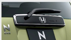
ブラック・リアライセンスガーニッシュ (クロームメッキ・モール)