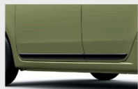
ブラック・サイドモール