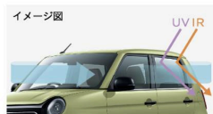
360°スーパーUV・IRカットパッケージ