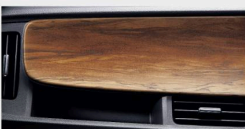
インパネガーニッシュ (タンウッド調)