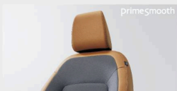
フロントコンピシート(プライムスムース& トリコット(タンメチャコル/グレースタッチ))