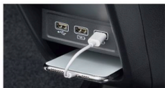
充電用USBジャック (急速充電対応タイプ2個付)