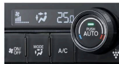
プラズマクラスター技術搭載 フルオート・エアコンディショナー