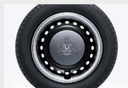
14インチスチールホイール 十ハブホイールキャップ (グレーメタリック)