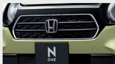
クロームメッキ・フロントグリルモール