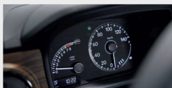
ブラックメーター