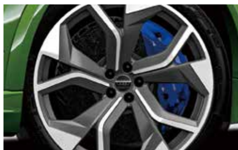
セラミックブレーキ(フロント) カラーブレーキキャリパー ブルー*

セラミックブレーキのディスクは、スポーツドライビング時の厳しい高熱応力の負荷にも耐えられるように開発。制動力とコントロール性に優れ、軽量化にも寄与します。