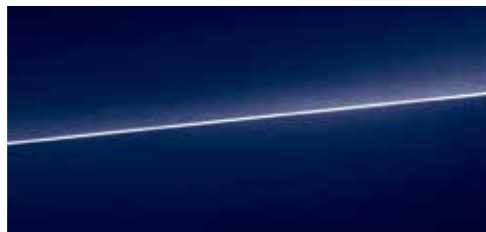
ナバーブルー メタリック