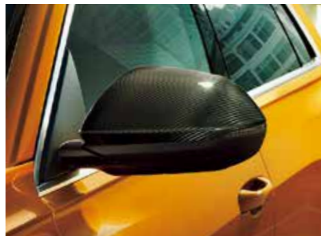
カーボンミラーハウジング 軽量化とスポーティさを演出します。