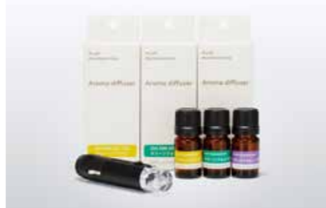
アウディアロマディフューザー シガーライターソケットに差し込むだけでアロマセラピーが楽しめる本革巻きディフューザー。Audiマークをバックから照らすLED照明付きです。エッセンシャルオイルには、植物から抽出された100%天然成分を使用。3つの香りからお選びください。