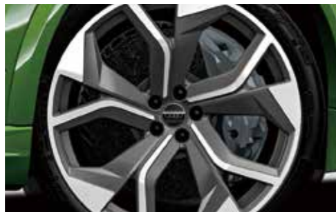
セラミックブレーキ(フロント) カラーブレーキキャリパー アンスラサイトグレー*