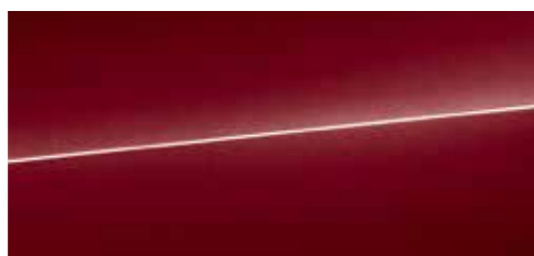
マトードルレッド メタリック