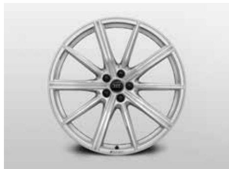
10スポークスターデザインアルミホイール 10J-22、インセット18、PCD112 (ウインタータイヤ用)

Audiと過ごす時間をひととき心地よく、さらに自分らしく。あなたにとってこの上なく魅力的なAudiに仕立ててください。