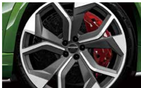
セラミックブレーキ(フロント) カラーブレーキキャリパー レッド*