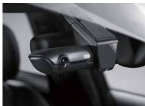
Audi ユニバーサルトラフィックレコーダー Audi専用デザインのドライブレコーダーです。専用アプリにてスマートフォン上で操作できます。レーダー感知作動による駐車監視や、イベントの自動録画、GPSによる自車位置検知など、多機能と高機能を兼ね備えています。フロント用とフロント&リヤ用があります。