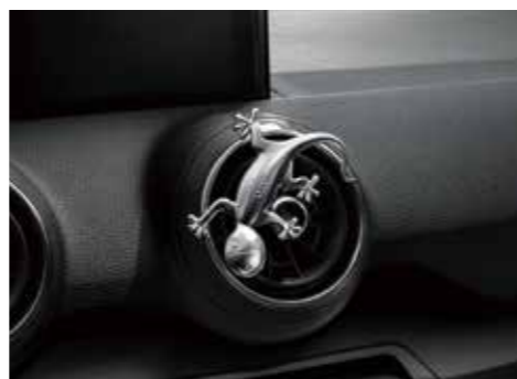
デザインゲッコー アルミ塗装のゲッコーマスコット。エアイベントに差し込んだり、マグネットでお好みの場所に固定できます。