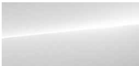
サテライトシルバー メタリック