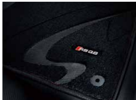
プレミアムスポーツフロアマット 高密度カーペットにリアルカーボンとアルミニウム製のエンブレムを使用。素材には花粉等のアレル物質を吸着し、雑菌の増殖を抑制させる「プレミアムクリーン」を使用した、車内をクリーンに保つ、高品質なフロアカーペットです。 カラー：ブラック