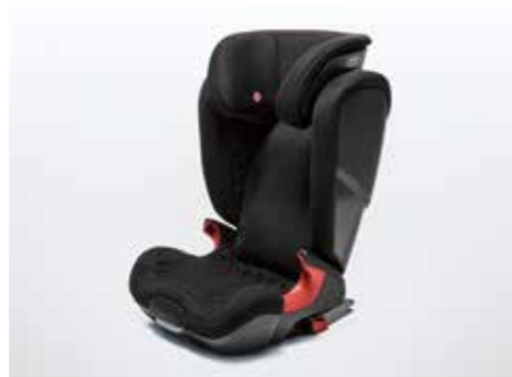
チャイルドシート Kidfix XP 幼児用シートは卒業、という小学生以下の児童用ジュニアシートです。ISO FIX固定フックとの一体型なので取り付けも簡単で、しかも安全です。座面を分割可能。22kgを超えるお子さま用に単独で使えます。ヘッドレスト、背もたれの角度調整が可能です。 カラー：ブラック