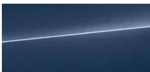
ワイトモブレード メタリック