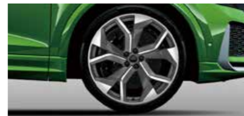
アルミホイール 5Yスポークロータースタイル マットチタニウムブラック 10.5J×23+295/35R23タイヤ