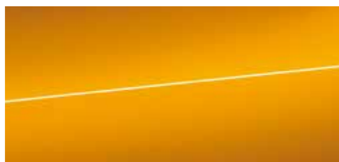
ドラゴンオレンジ メタリック