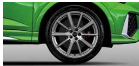
アルミホイール 10スポークスターデザイン 8.5J×20+255/40R20タイヤ