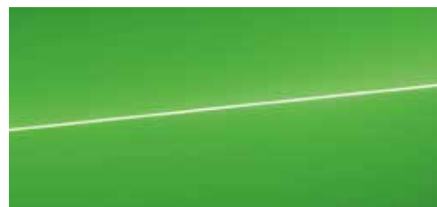
キャラミグリーン