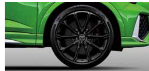
アルミホイール 5Vスポークポリゴンデザイン ブラック 8.5J×21+255/35R21タイヤ*