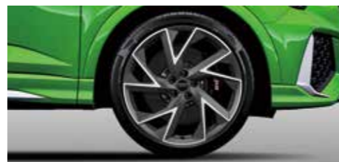
アルミホイール 5アームトリゴンデザイン マットチタングレー 8.5J×21+255/35R21タイヤ*