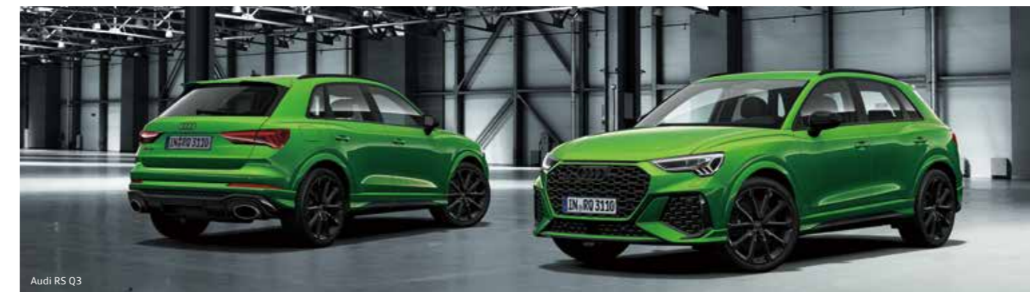
Audi RS Q3

*1 オプション。*2 Audi RS Q3にのみ設定。 ※アルミホイール 5Vスポークポリゴンデザイン ブラック8.5J×21+255/35 R21タイヤ装着車