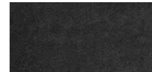
ブラック [ダイナミカルレザー RS ロゴ]