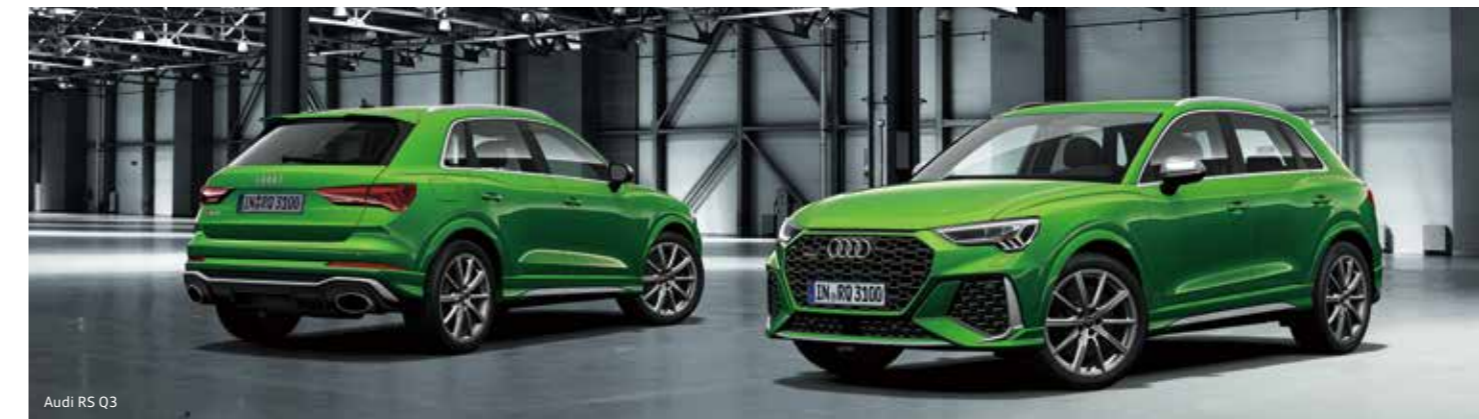
Audi RS Q3