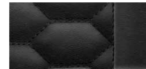
ブラック [ファインナップレザー]* (RSデザインパッケージレッド選択時)