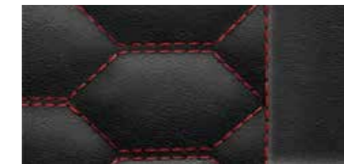
ブラック (エクスプレスレッドステッチ) [ファインナップレザー]* (RSデザインパッケージエクステンデッドレッド/RSスポーツシート選択時)