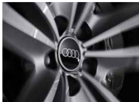
ダイナミックハブキャップ 走行中でも常にフォーリングスが水平方向を向いているハブキャップです。4個1セット。