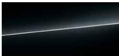
ミトスブラック メタリック