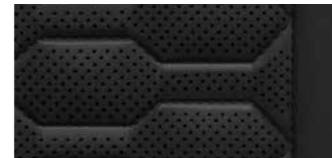
ブラック [バルコナレザー]