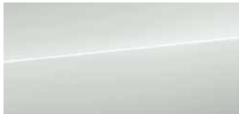
グレイシアホワイト メタリック