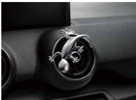
デザインゲッコー アルミ塗装のゲッコーマスコット。エアイベントに差し込んだり、マグネットでお好みの場所に固定できます。