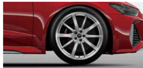
アルミホイール 10スポークスターデザイン 10.5J×21+275/35R21タイヤ