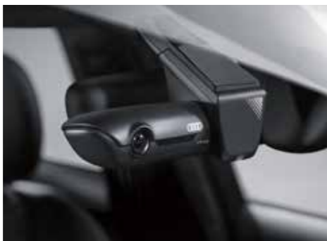
Audi ユニバーサルトラフィックレコーダー Audi専用デザインのドライブレコーダーです。専用アプリにてスマートフォン上で操作できます。レーダー感知作動による駐車監視や、イベントの自動録画、GPSによる自車位置検知など、多機能と高機能を兼ね備えています。フロント用とフロント&リヤ用があります。