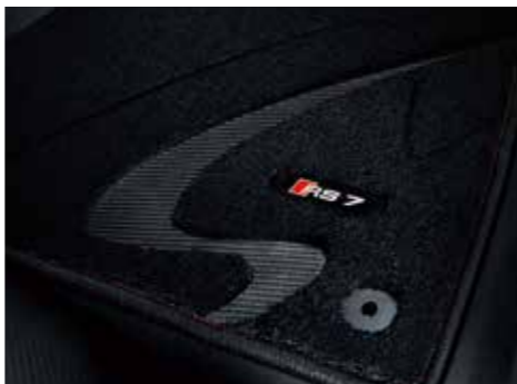
プレミアムスポーツフロアマット 高密度カーペットにリアルカーボンとアルミニウム製のエンブレムを使用。素材には花粉等のアレル物質を吸着し、雑菌の増殖を抑制させる「プレミアムクリーン」を使用した、車内をクリーンに保つ、高品質なフロアカーペットです。カラー：ブラック