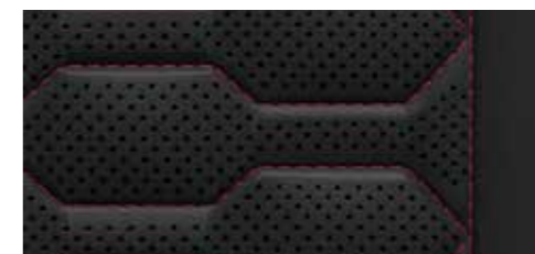
ブラック (エクスプレスレッドステッチ) [バルコナレザー]