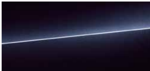
セブリングブラック クリスタルエフェクト