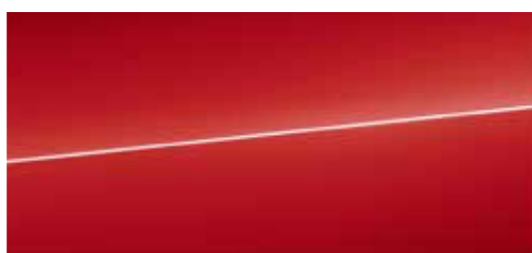
タンゴレッド メタリック