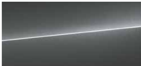
デイトナグレー パールエフェクト