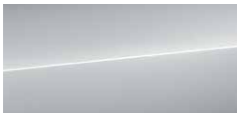
フロレットシルバー メタリック