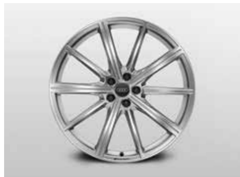
10スポークスターデザインアルミホイール 10.5J-21、インセット19、PCD112 (ウインタータイヤ用)

Audiと過ごす時間をひととき心地よく、さらに自分らしく。あなたにとってこの上なく魅力的なAudiに仕立ててください。