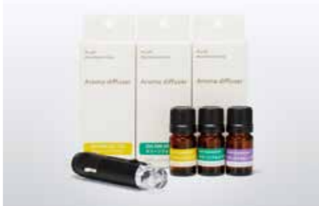
アウディアロマディフューザー シガーライターソケットに差し込むだけでアロマセラピーが楽しめる本革巻きディフューザー。Audiマークをバックから照らすLED照明付きです。エッセンシャルオイルには、植物から抽出された100%天然成分を使用。3つの香りからお選びください。