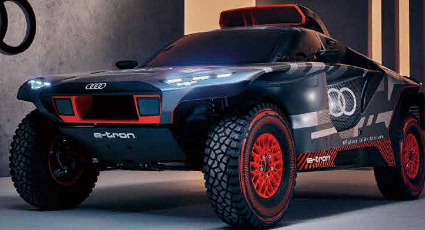
Audi RS Q e-tron