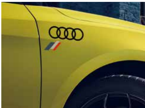
ヘリテージフラッグ&4リングフィルム ヘリテージフラッグ付きAudiマークのフィルムです。カラーはブラックとシルバーの2種類をご用意しています。