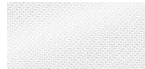
アルミニウムメース