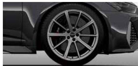
アルミホイール 10スポークスターデザイン 10.5J×21+275/35R21タイヤ