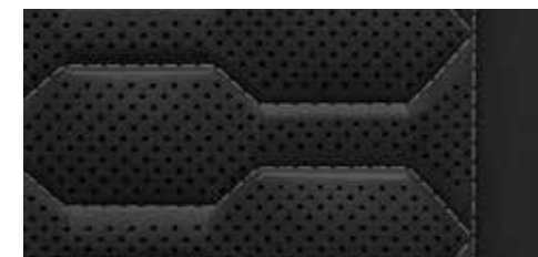
ブラック (ロックグレーステッチ) [バルコナレザー]