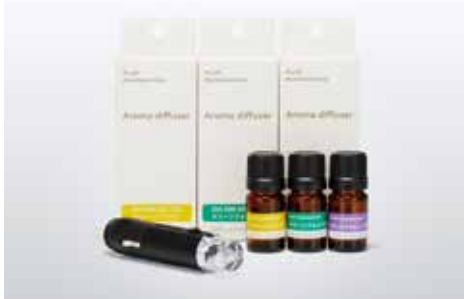
アウディアロマディフューザー シガーライターソケットに差し込むだけでアロマセラピーが楽しめる本革巻きディフューザー。Audiマークをバックから照らすLED照明付きです。エッセンシャルオイルには、植物から抽出された100%天然成分を使用。3つの香りからお選びください。