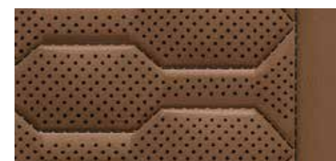
コニャックブラウン (ロックグレーステッチ) [バルコナレザー]