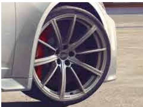
10スポークスターデザインアルミホイール 10.5J-21、インセット19、PCD112 (ウインタータイヤ用)

Audiの美しいスタイリングや高い実用性をさらに輝かせる、数々の純正アクセサリをご用意いたしました。Audiと過ごす時間をひととき心地よく、さらに自分らしく。あなたにとってこの上なく魅力的なAudiに仕立ててください。