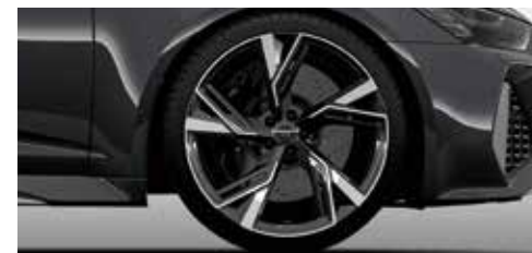
アルミホイール 5Vスポークグロスアントラサイトブラック 10.5J×22+285/30R22タイヤ*