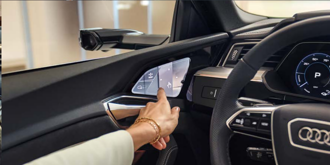
Audi Q8 Sportback 55 e-tron quattro S line [オプション装着車] 写真は欧州仕様です。日本仕様と異なります。日本仕様は右ハンドルとなります。