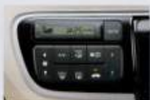
フルオート・エアコンディショナー 優れた空調性能を実現。スモーカーなどのアレルゲンを抑えシャットアウトするアレルフリー高性能抗菌フィルターの付。 ■室内のアレルゲンを吸い取り分解。花粉などは分解して、フィルターの裏に捕獲。99.9%の効率で除去。