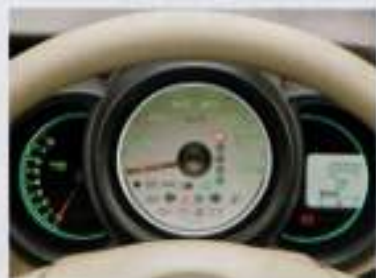
常時点灯3眼メーター 燃費のいい運転時に中央のメーターリングがグリーンに光る機能も装備。