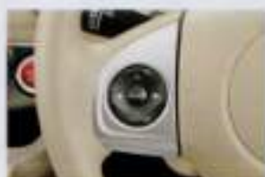
照明付オーディオリモートコントロールスイッチ ステアリングから手を放さずに、手軽にオーディオ操作が可能。 ■マイナビナビシステムに接続して、ナビと連携して操作も可能。