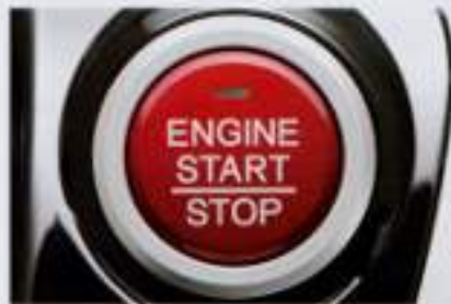
プッシュエンジンスター/ ストップスイッチ (スイッチ照明付) エンジンのON/OFFがワンプッシュで可能。 ■エンジンスター/ストップスイッチは、ブレーキを踏んだ状態で操作。