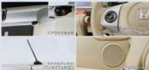
Honda純正ナビゲーションの使い勝手を、さらに高めるオプションをご用意。快適・安心のドライブをサポートします。 ※ナビゲーションシステムはナビゲーションシステム専用パッケージが必要です。 ■ナビゲーションシステムはナビゲーションシステム専用パッケージが必要です。詳しくは販売店にお問い合わせください。 ※標準装備車・後述のナビゲーションシステム