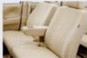
アレルクリーンシート シート表皮にダニや花粉などのアレルゲン物質が付着した際、その活動をほぼ完全に抑制*。 ■V7A搭載車 ※V7A搭載車は、アレルクリーンシートが標準装備。V7A以外のグレードは、オプションで追加可能。