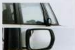
暖水/ヒーター付ドアミラー + フロントドア撥水ガラス 曇りや雨滴を取り除くドアミラーと水をはじくフロントドアガラスを採用。 ※V7A搭載