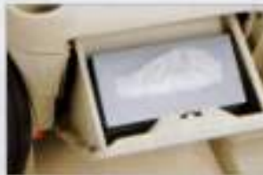
グローブボックス 重要証などを入れたままでも、その上から薄型のボックスフィッシュが浮かぶように設計。「ふだんは見えないように、でも使うときはスグに」。そんな声に応えるアイデアです。