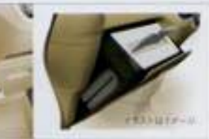
その他の便利な収納 身の回りの小物類がすっきり収まる。使い勝手のいいサイズの収納を各部に装備。