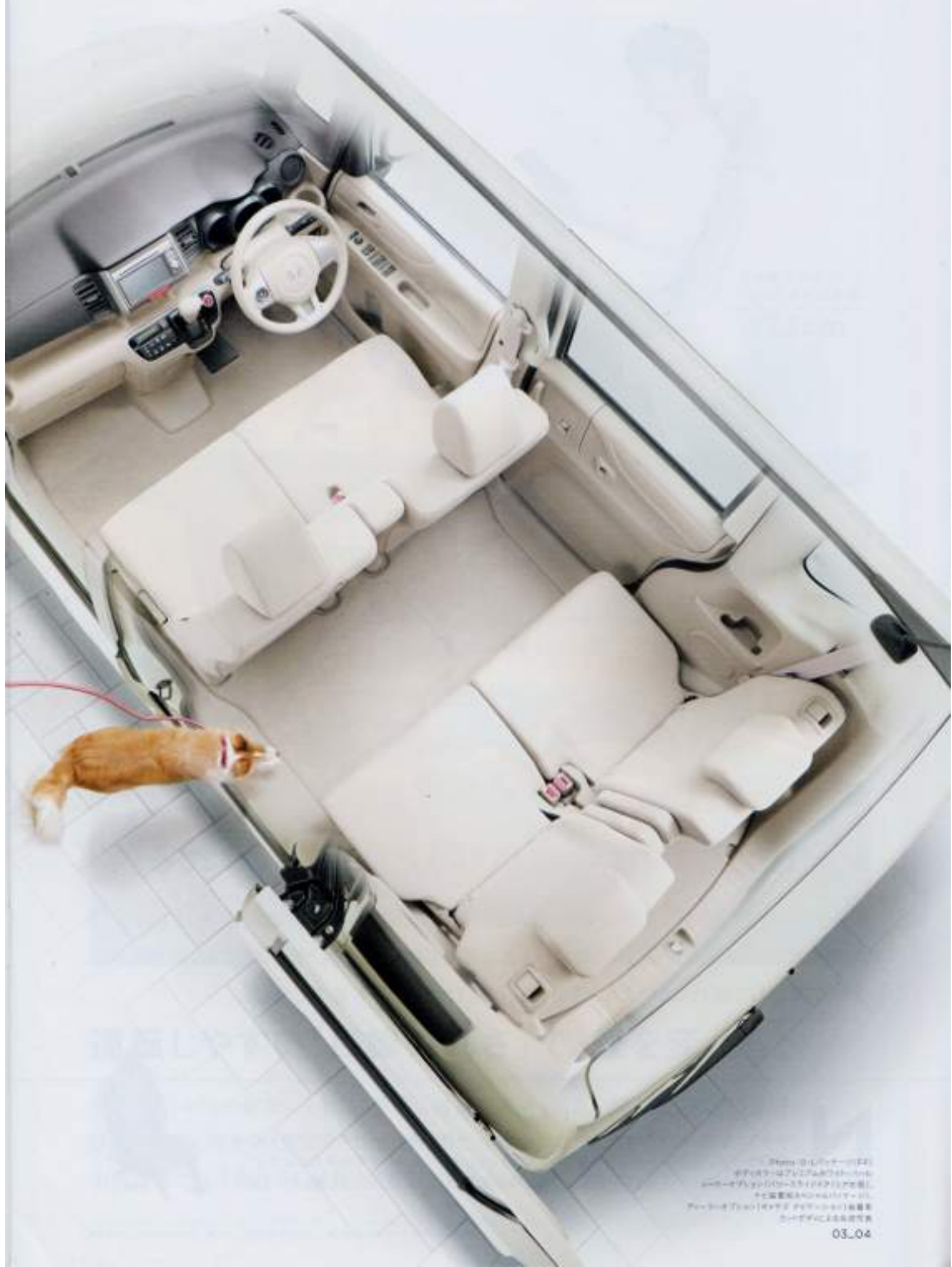
モデル: 2003-04 Ford Focus SE (USA) メーカー: Ford (USA) 年式: 2003 ボディカラー: 白 インテリアカラー: 白 メーカー: Ford (USA) 年式: 2003