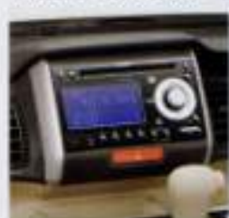
オーディオ WX-I28CU インパネにフィットするデザイン。機能も充実。 ■ディーラーオプションにはナビゲーションシステムも追加可能ですが、詳しくは販売店にお問い合わせください。 ※標準装備車・後述のナビゲーションシステム