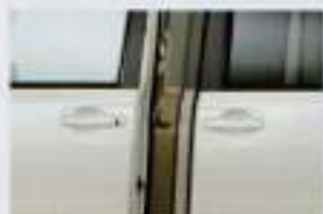
パワーライドドア (V7A搭載) + スライドドア・イージークローザー (V7A搭載) リモコンなどでラクに自動開閉。またキック足踏まで閉めると後は自動的に全閉も。 ※V7A搭載車 ■パワーライドドア/イージークローザーは、マイナビナビシステムで操作。