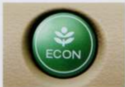
ECONモード エンジンやCVT、空調などを協調制御して燃費向上に貢献。ON/OFFの切替は自由。