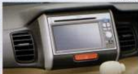
ナビゲーション VXM-I28V5 ワンセグTVやDVD/CD再生にも対応。大きめのボタンで操作しやすいベークシックモデル。 ■ディーラーオプションにはナビゲーションシステムも追加可能ですが、詳しくは販売店にお問い合わせください。 ※標準装備車・後述のナビゲーションシステム