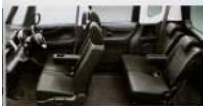
フロントシート—一部アップ