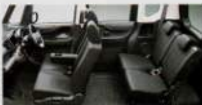
ホンダN-VAN (FF) 4WD