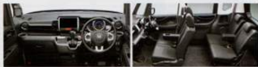
インテリア—一部アップ