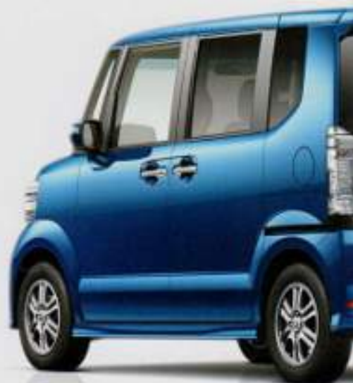
ホンダN-VAN (FF) G・Lパッケージ