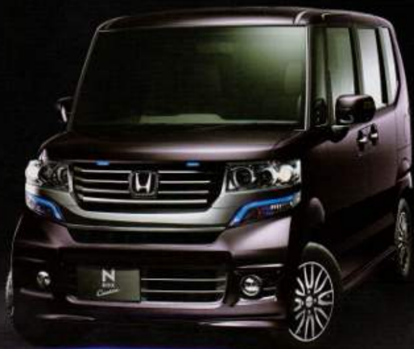
Photo: 田中 洋一/写真家。アクセサリはすべて純正部品です。N-BOX Customのデザインは、ホンダのデザインチームによって開発されています。

夜の闇の中、ブルーLEDの光が、佇まいの個性を研ぎ、空間のやすらぎを深める。 N-BOX Customの独特な存在感に自分流の彩りを与える、純正アクセサリ。