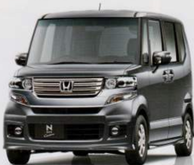
ホンダN-VAN (FF) 標準パッケージ