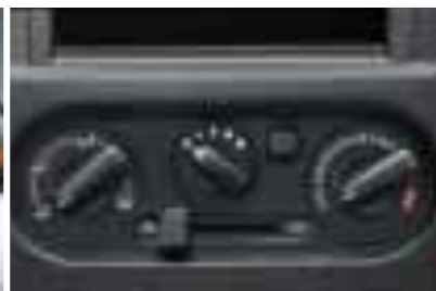
エアコン [抗菌処理タイプ・エアフィルター付]