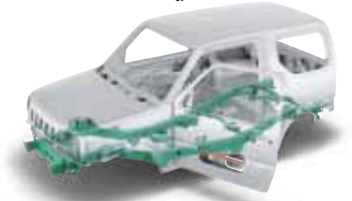
*写真は機能説明のため撮影したものです。ラダーフレームとサイドアビームは説明のため着色したものです。