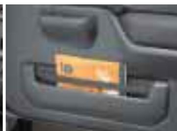
ドアポケット(サイド両側)