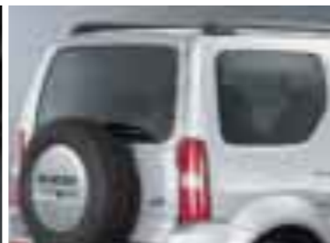
UVカット機能付スモークガラス(クォーター、バックドア) 強い日差しの中でも、心地よいドライブを楽しめるように配慮し、UVカットガラスとスモークガラスを採用しました。また、フロント合わせガラス、熱線吸収グリーンガラスとあわせて全面UVカット効果があります。(UVカット率:サイドドアUVカットガラスは約90%カット、スモークガラスは約90%カット、フロント合わせガラスは約99%カット)。