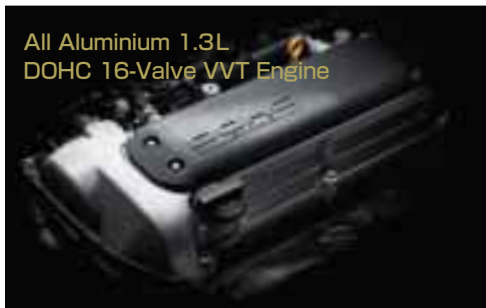
All Aluminium 1.3L DOHC 16-Valve VVT Engine

最高出力(ネット) 65kW/6,000rpm 最大トルク(ネット) 118N・m/4,000rpm <88PS/6,000rpm> <12.0kg・m/4,000rpm> ( )内は旧単位での参考値です。