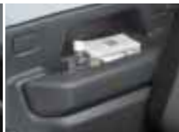
リヤクォータートレイ [カップホルダー兼用] (両側)