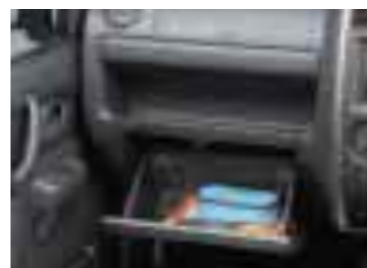
インパネトレー(助手席)／キー付グローブボックス