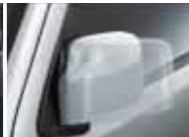
カード電動格納式リモコンドアミラー