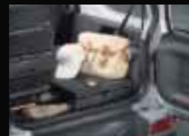
ラゲッジフラットパネル

*ナビゲーションシステムは販売会社装着アクセサリです。(画面はハモミ合成です。)