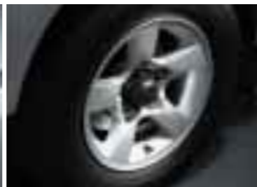
15インチアルミホイール