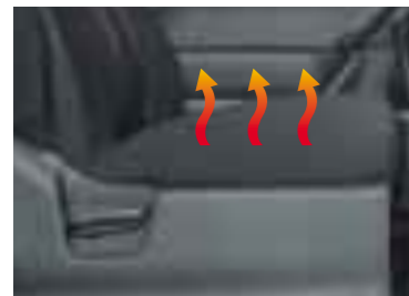
運転席・助手席シートヒーター