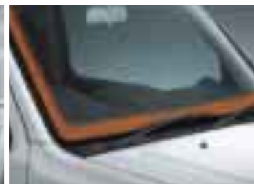
デアイサー フロントウインドーに配された熱線が、ガラスとワイパーブレードとの凍結による固着を防止します。(写真の■部分)