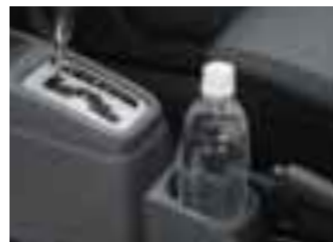
センターコンソールボックス [カップホルダー兼用] (AT車)