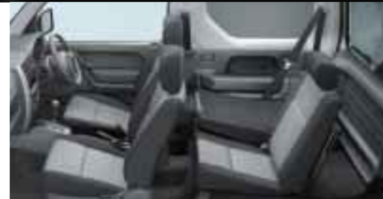
*リヤシートを片方倒したときの乗車定員は3名です。