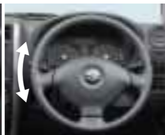
パワーステアリング