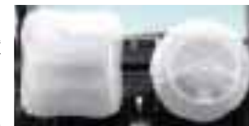
エアバッグ膨張時 (合成写真)

●SRSエアバッグシステムは、シートベルトを補助する装置ですので、必ずシートベルトをご着用ください。●SRSエアバッグシステムは衝突の条件によっては作動しない場合があります。また、ご注意ください項目がありますので、必ず取扱説明書をよくお読みください。 SRS=Supplemental Restraint System (補助拘束装置) ■写真は機能説明のためにSRSエアバッグが作動した状態を合成したものです。