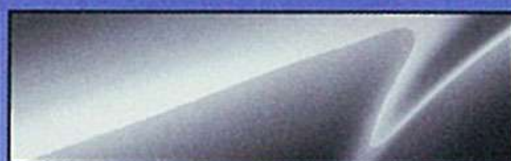
メトロポリタングレーマイカ