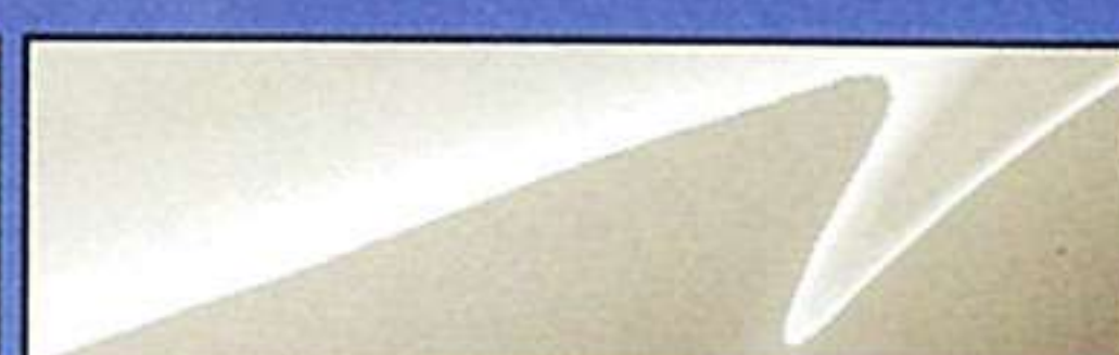
マーブルホワイト(ソフトトップモデルのみ)