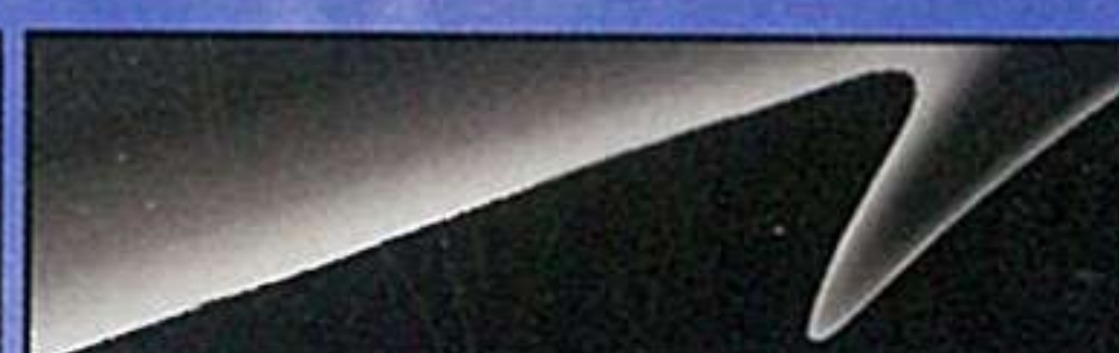
プリリアントブラック