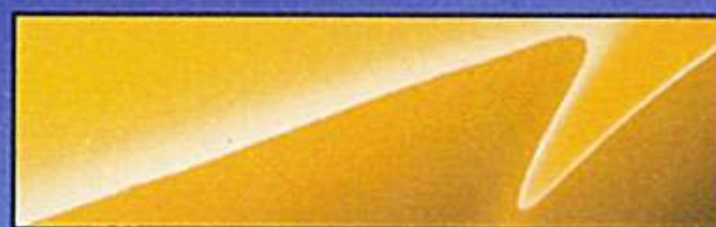
サンフラワーイエロー