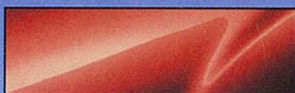
カッパーレッドマイカ