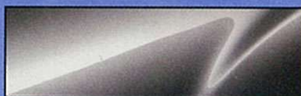
アルミニウムメタリック