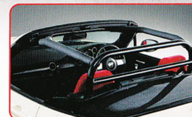
●ロールバーセット(ブラック) ●ロールバープロテクター(ブラック)