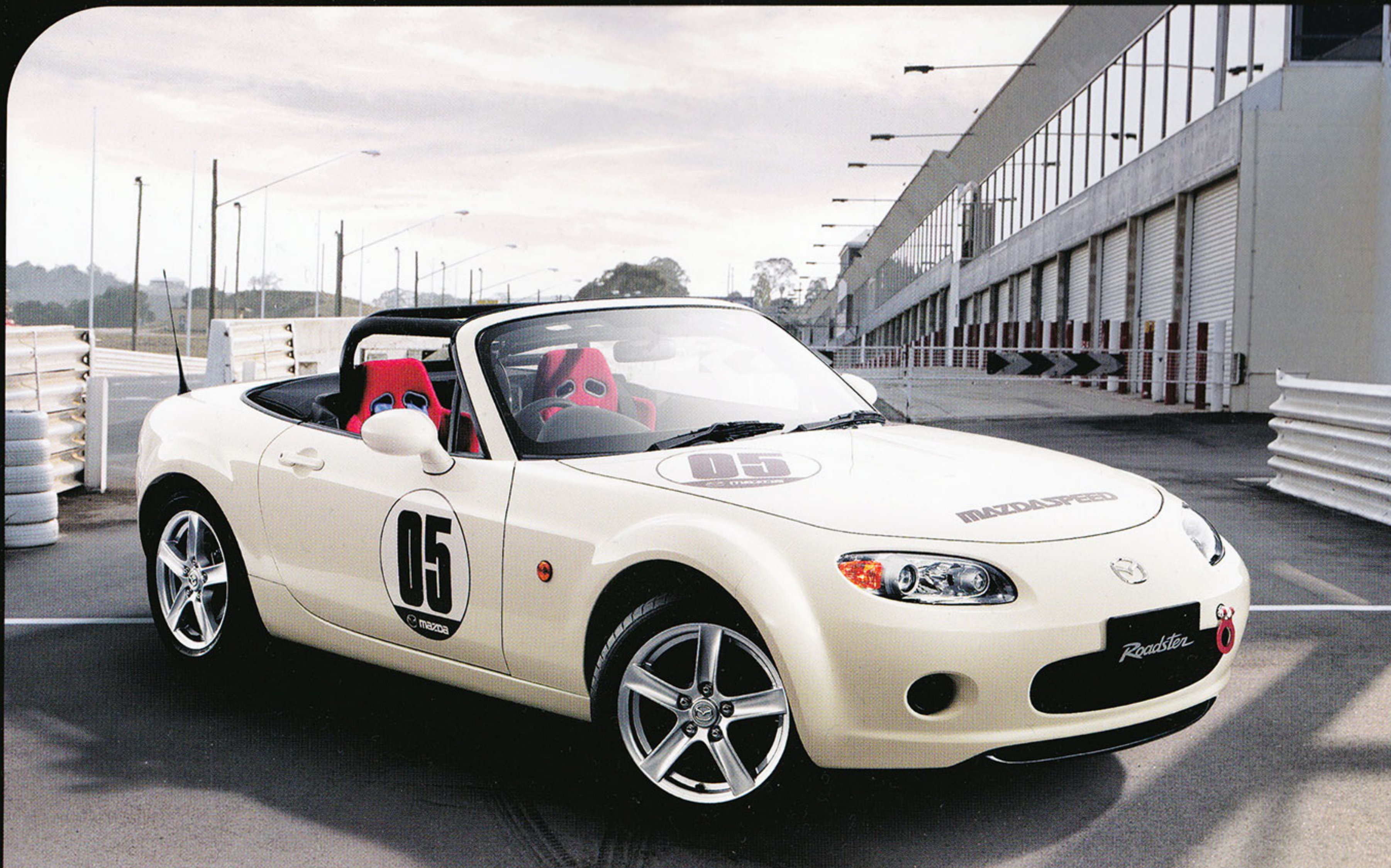
Photo: メーカーオプション: 16インチアルミホイール ショップオプション: ロールバーセット(ブラック)、ロールバープロテクター(ブラック)、牽引フック、スポーツシートTYPE-F装着車 ※競技用4点式シートベルト、マツダスピードステッカー、ゼッケンステッカーは撮影のための参考装着品。 Body Color: マーブルホワイト

コの字型のバーで左右のフロントダンパーユニット上部とカウル部を結合し、より優れた操縦安定性と上質な乗り心地を高次元で両立させる。