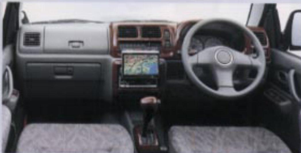
●ボイスコントロールナビゲーション(パイオニア) ●ウッド調インパネ ●ウッド調シフトノブカバー(AT車用) ●ウッド調セレクトインジケーターベゼル(AT車用) ●ウッド調パワーウィンドースイッチベゼル