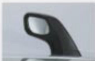
サイドアンダーミラー

Photo:XC フロントウィンドー・サイドウィンドーの面積が大きく、しかもアイポイントが高いため、視界も広く周囲の状況も確認しやすくなっています。また、スペアタイヤの取り付け位置が低いので、広い後方視界を確保しています。