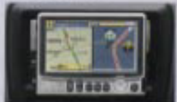
インダッシュナビゲーションシステム(サンレー)