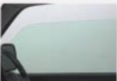
UVカットガラス(サイドドア)(XC、XL)

自然な姿勢で手に馴染むステアリング、プッシュ式空調モードスイッチ(XC)をはじめ操作性を高めたスイッチ類。より快適に走るための装備を充実させました。