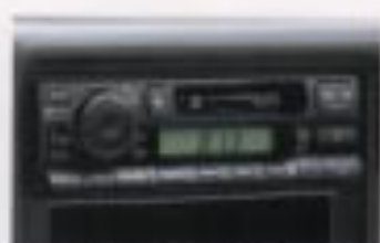
AM/FMラジオ付 カセットステレオ(XC)

サイドドアのUVカットガラスは紫外線を約90%カット。フロントウインドーは合わせガラスで約99%もカットします。スモークガラスを採用しているXCは、全車UVカット効果を発揮します。