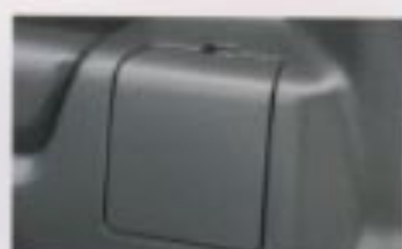
ラゲッジポケット (両側)

*1 XL, XAはツリ上げ無しとなります。DPOエアバッグも4種AISの装着車には装着されません。