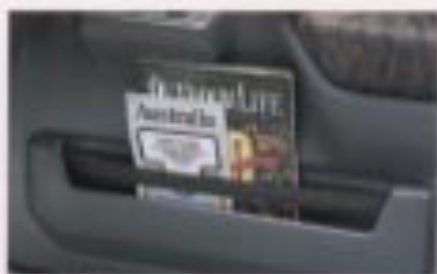
ドアポケット (両側) XC, XL