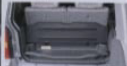
リヤラゲージボックス