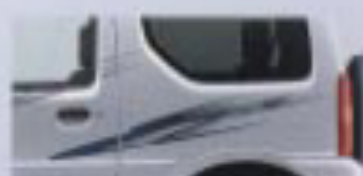
ストライプテープ(プラス)