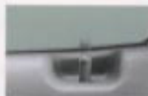
パワードアロック (XC, XL)

*写真は機能説明のためにもランプを点灯したものです。実際の走行状態も異なります。