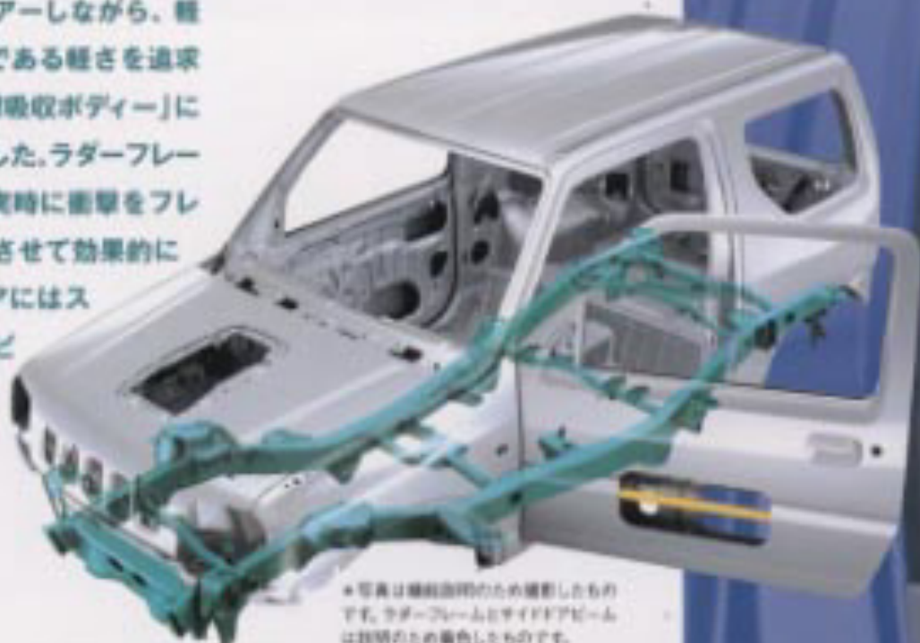
※写真は撮影目的のため撮影したもので、ラダーフレームとサイドドアビームは実際とは異なる色としたものです。

新しい安全基準をクリアしながら、軽自動車本来のメリットである軽さを追求した新開発の「軽量衝撃吸収ボディ」により、安全性が高まりました。ラダーフレーム付のボディは、衝突時に衝撃をフレームとボディに分散させて効果的に吸収。また、サイドドアにはスチール製のサイドドアビームも内蔵しています。