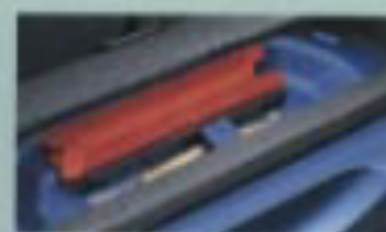
ラゲッジアンダーボックス *2角等は積込アクセサリー(別売)。