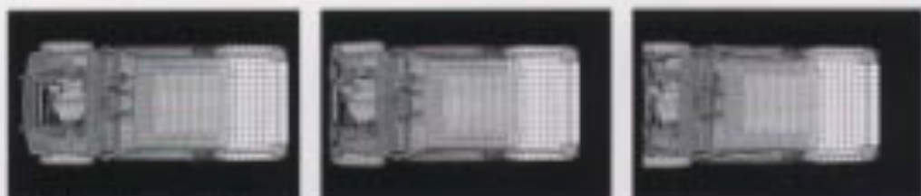
衝突実験コンピュータシミュレーション