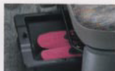
シートアンダートレー (助手席) XC

必要な物がすぐ手の届く場所に置ける新型ジムニーの室内。前席から後席ラゲッジスペースまで、豊富な収納スペースを機能的にレイアウトしています。