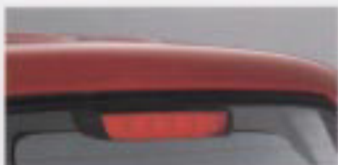
ハイマウントストップランプ ※1