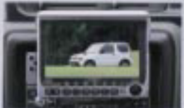
広角インテリワイド 液晶カラーテレビ(カラリオン) ※画面はハメコ1合式です。