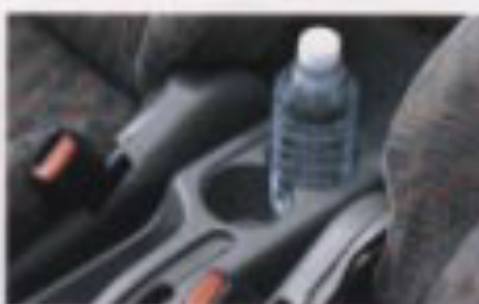
フロアコンソールボックス (スリッパホルダー兼用)