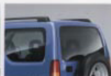
スモークガラス(フロントウインドー)(XC)

サイドドアのUVカットガラスは紫外線を約90%カット。フロントウインドーは合わせガラスで約99%もカットします。スモークガラスを採用しているXCは、全車UVカット効果を発揮します。