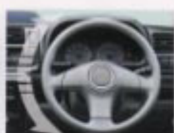
パワーステアリング