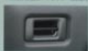
リヤクォーターフック (XC)