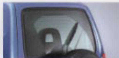
熱線入りバックウィンドーガラス/リヤワイパー&ウォッシャー ※1,XC