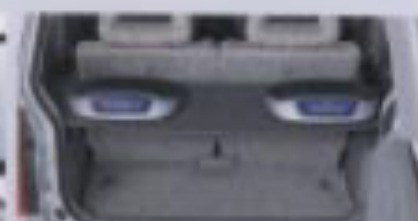
オーディオシェルフ