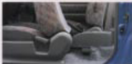
助手席ウォークイン

*走行中は常に二人を乗せたいでください。*フルフラットにしない状態で走行しないでください。*乗客のほかにシートベルトが本来の効果を発揮できない場合があります。必要以上にシートを背もたれを倒して乗らないでください。