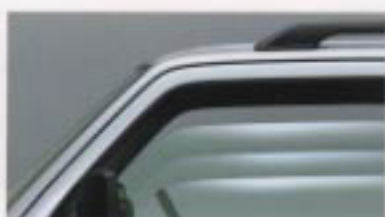
パワーウィンドー (運転席側・助手席側付) (XC, XL)