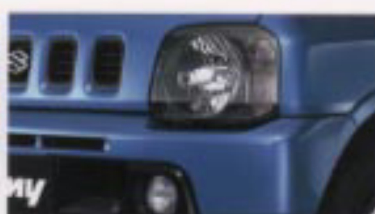
マルチリフレクターハロゲンヘッドランプ/ ハロゲンフォグランプ (XC)