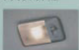
3ポジションラゲッジ ルームランプ (XC)