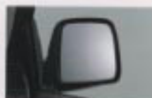
電動リモコンドアミラー (XC)