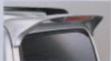
ルーフレールエンドスボイラー