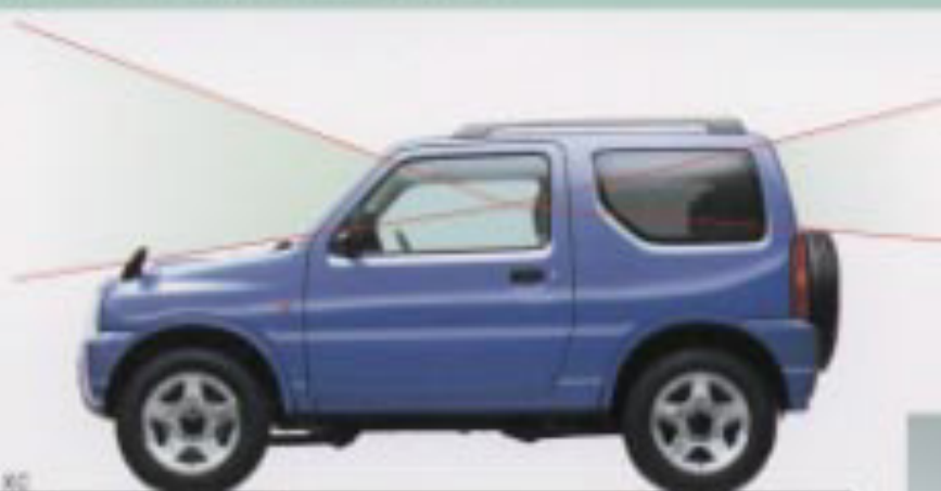
Photo:XC フロントウィンドー・サイドウィンドーの面積が大きく、しかもアイポイントが高いため、視界も広く周囲の状況も確認しやすくなっています。また、スペアタイヤの取り付け位置が低いので、広い後方視界を確保しています。