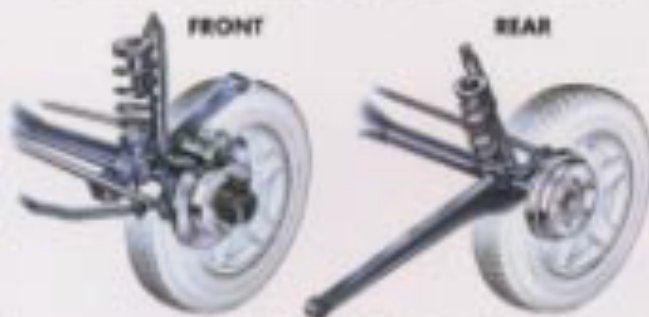
[3リンクリジッドサスペンション] NEW 4×4 SUSPENSION

もコイルスプリングとショックアブソーバーを分離してレイアウトする方式を新たに採用。それぞれの機能をフルに発揮させ、路面からの衝撃を分散して吸収します。さらに、サスペンションストロークもアップするなど、悪路走破性と乗り心地を高次元で両立させています。