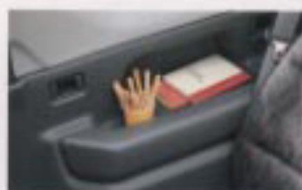
リヤクォータートレイ (両側)