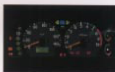
大型メーターパネル

*24時間24時間監視機能の受信機に向けて約24m以内の距離で操作してください。