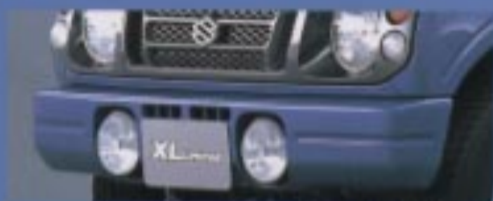
フルカラーバンパー