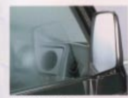
サイドデフロスター