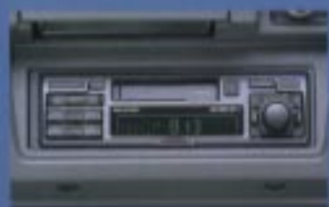
ADDZEST ハイパワー AM/FMラジオ付カセットステレオ