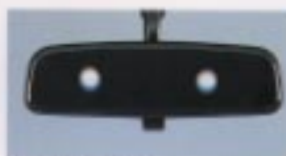
防眩式ルームミラー