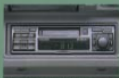
ADDZESTハイパワーAM/FM ラジオ付カセットステレオ

エアコン 365日室内を爽快にするエアコンを装備。優れた除菌効果で、梅雨時のドライブも快適。ウィンドウの曇りも抑えてくれます。