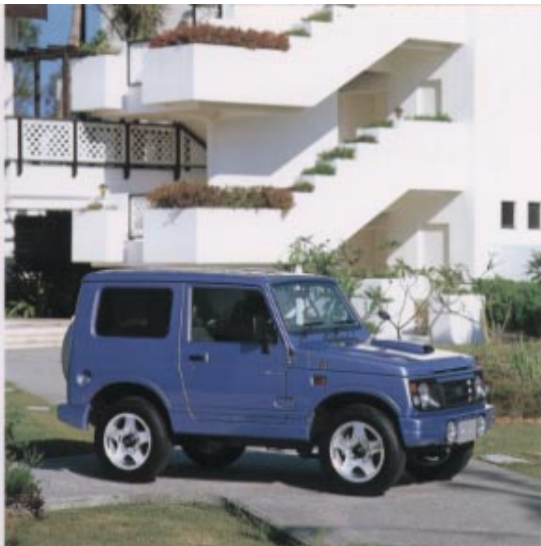
Body color: マイアブルーメタリック(28M)