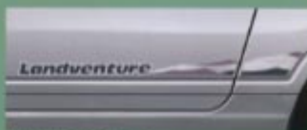
サイドストライプテープ