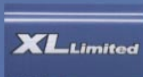
サイドディカール