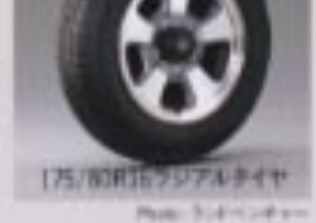
175/80R16ラジアルタイヤ

オフロードでは十分な最低地上高を確保し、溝や凹凸のある路面で優れた走行性を発揮。オンロードでは快適な乗り心地を実現しています。