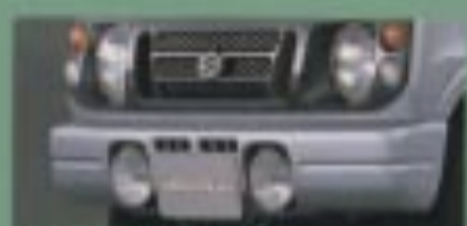
フルカラードバンパー

専用ショックアブソーバー ランドベンチャー専用ショックアブソーバーをファインチューニング、フリクションを低減し、ショックのなめらかな作動を実現。オフロードでの走行安定性と、インロードでの乗り心地を向上しています。