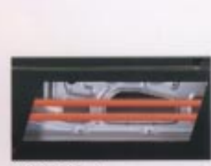
サイドドアビーム