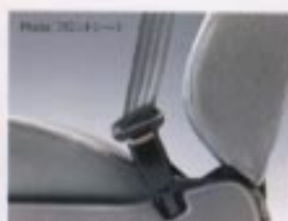
ELR3点式シートベルト(フロント・リヤ) フロントベルトインシート