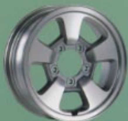
16インチアルミホイール (16インチアルミホイールはオプションです。)