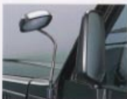
サイドアンダーミラー

万一の際に備えた、運転席SRSエアバッグ&4輪ABSを設定。 (セットでメーカーオプション※2) 安心感あるドライビングを楽しむために、数々の装備を採用しています。