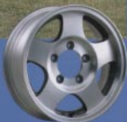
16インチアルミホイール (28インチメタリックメタリック(28M)は別)