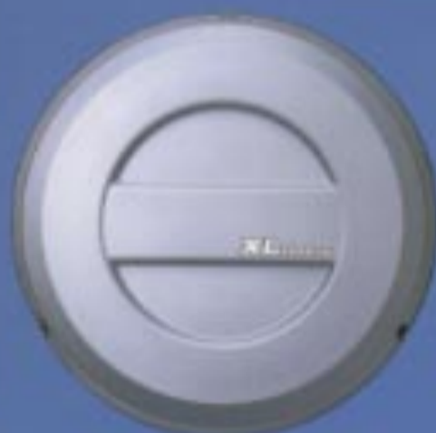
スベアタイヤハウジング*