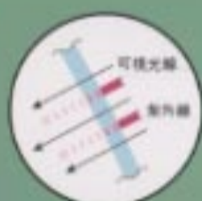
UVカットガラス (サイドドア)