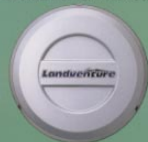
スベアタイヤハウジング*