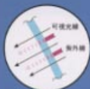
UVカットガラス (サイドドア)

スモークガラス (クーラーウィンドー/バックドア) サイドドアのUVカットガラスは紫外線を90%以上、フロントウィンドーは合わせガラスで約90%もカット、さらにスモークガラスを採用することで、全面UVカット効果を実現しています。紫外線が気になる海や山へのドライブも安心です。