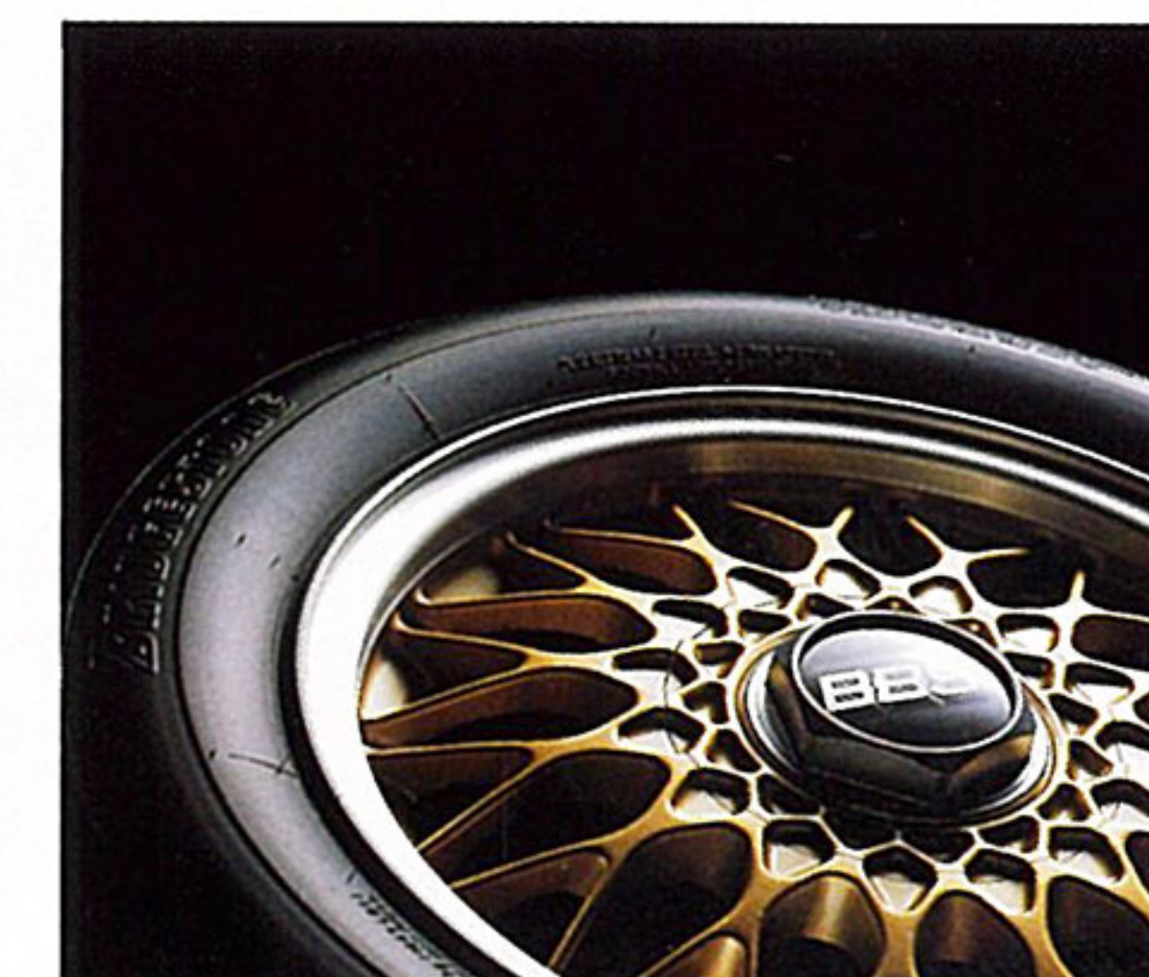
BBS社製アルミホイール(ゴールド)

ハイセーフティー、軽量・高剛性ボディ&シャシー。 最新のコンピューター解析技術を駆使し、軽さと強さを高次元で両立したオープン専用ボディを開発。頑強なボディが生むネジレ剛性の高さがステアリング操作にリアに即応するダイレクトな車体追従を支える。そして、この堅固なボディは万一のアクシデントにも高い安全性能を発揮。ドア内部に装着したサイドインパクトバーと相まって、乗員を安全に保護する。また、インテリアには2次災害に留意し、燃えにくい難燃素材を多用している。