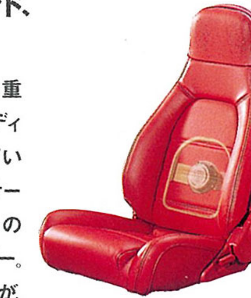
トランスデューサー(振動板)内蔵シート

体で味わうオープンカー専用サウンド、センソリーサウンドシステム。 Sリミテッドは、オープン走行時に不足しがちな重低音と高音をよりダイナミックに再生するオーディオ「センソリーサウンドシステム」を標準装備している。これは、シートに組み込んだトランスデューサー(振動板)が、重低音を振動に変換してリスナーの体に伝える独自のオープンカー専用テクノロジー。さらに、ドアトリム部に備えた高性能ツイーターが、伸びのいいクリアな高音を忠実に再生。ドアスピーカー、ヘッドレストスピーカーなどを加えた合計8スピーカーシステムにより、オープン走行時にも音像定位にすぐれたビュアなサウンドがたっぷり満喫できる。また、高密度なデジタルサウンドを再生するCDデッキも装備している。音楽のエッセンスを、体で味わうセンソリーサウンドシステム。オープンエアの楽しさが、さらに大きく広がっていく。