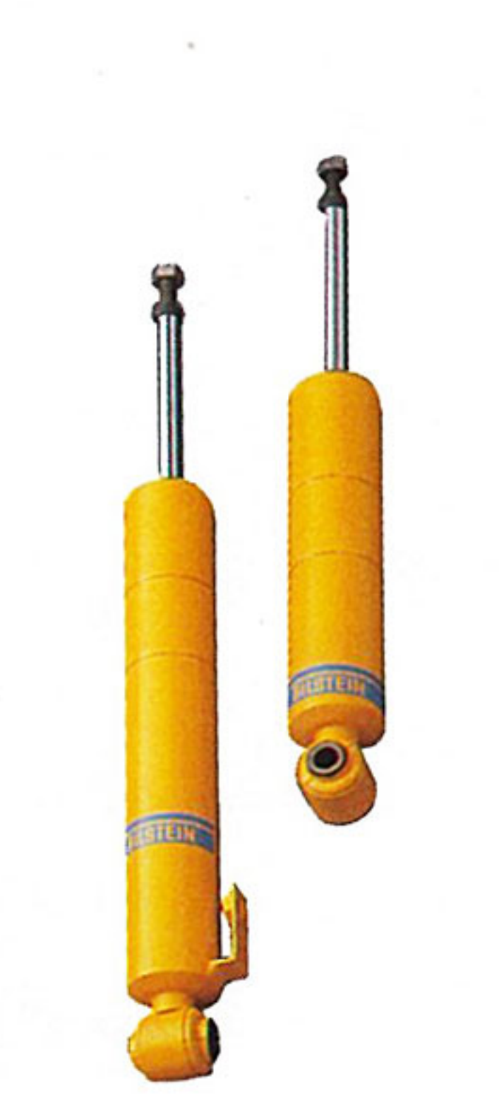
ビルシュタイン社製ダンパー

全域クイックレスポンス、1600DOHC16バルブエンジン。 パワーユニットは、最高出力(ネット*)120ps/6500rpm、最大トルク14.0kg-m/5500rpmを発生する自然吸気1600DOHC16バルブエンジン。高回転型のカムタイミング、独自の吸気ポートの採用などにより、レッドゾーンまで一気に吹き上がる回転特性を実現している。駆動方式はFR、しかも、トランスミッションとデフをリジットに結合するアルミ製PPF(パワープラントフレーム)が俊敏なトルクの伝達を叶え、ダイレクトなスロットルレスポンスをもたらす。 *「ネット」とはエンジンを車両搭載状態で測定したものです。