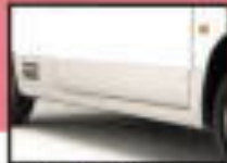
●サイドフォグランプ 雨天や霧の多い状況下で視界を確保するための装備です。