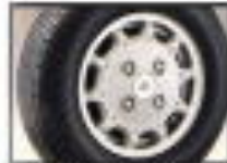
●16インチ専用16インチアルミホイール