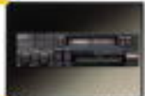
電子チューニング式AM/FMラジオ付きセットステレオ (インパネ取)