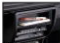
●フロントボックス 小物の収納に便利です。