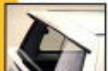
リヤビューミラー (ハイマウントストップランプ付)