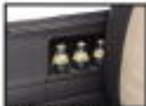
●ササヤイボケタ 雨天時の便利さを追求しました。