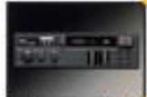
電子チューニング式AM/FMラジオ付きセットステレオ (インパネ取)