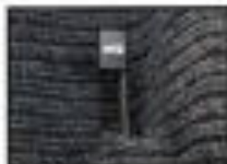
●バックドアキー 小物の収納に便利です。