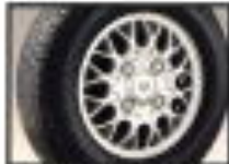
●16インチ専用16インチアルミホイール