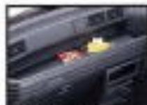
●フロントシート間の収納スペース 小物の収納に便利です。