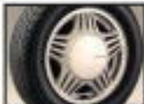
●16インチ専用16インチアルミホイール