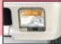
●フロントフォグランプ 雨天や霧の多い状況下で視界を確保するための装備です。