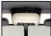
●リアシートヘッドレスト 運転時の快適性を追求しました。