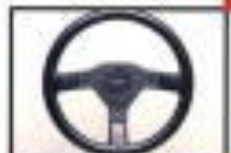
黒色ステアリング