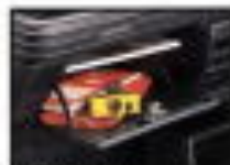
●リアボックス 小物の収納に便利です。