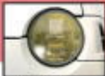
●ハジメヘッドランプ 雨天や霧の多い状況下で視界を確保するための装備です。