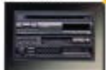
CDプレーヤー電子チューニング式AM/FMラジオ付きセットステレオ