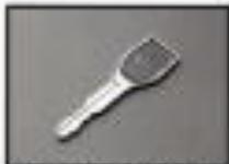
●防犯カメラ搭載用カメラキー 小物の収納に便利です。