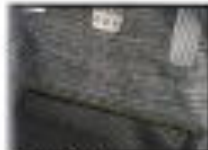
●セルスター [国産] 小物の収納に便利です。