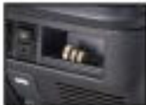
●コインケース 小物の収納に便利です。