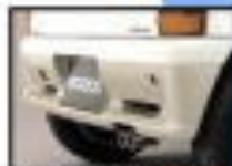
●リアフォグランプ [標準] 雨天や霧の多い状況下で視界を確保するための装備です。