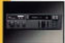
オートスペースリフトシステム (コンソールボックス取)