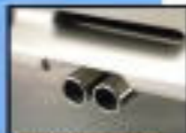
●デュアルエキゾーストパイプ エンジン音の抑圧や燃費効率の向上に貢献します。