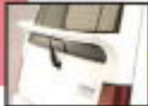
●リアフォグランプ 雨天や霧の多い状況下で視界を確保するための装備です。