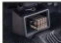
●ヒーターコントロールユニット [国産] 快適な室内環境を実現します。