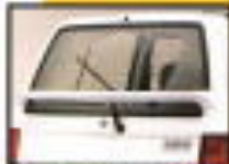
●新入車に標準装備のリアフォグランプ 雨天や霧の多い状況下で視界を確保するための装備です。