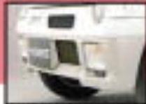
●リアフォグランプ [標準] 雨天や霧の多い状況下で視界を確保するための装備です。