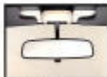
●可動式インナーミラー 運転時の視界確保に貢献します。