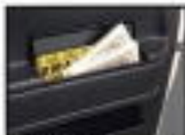
●ドアポケット [国産] 小物の収納に便利です。