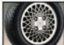
●16インチ専用16インチアルミホイール