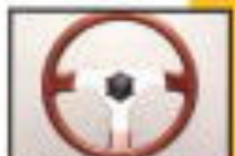
ホワイトステアリング