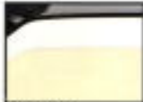
●アルミボディ 錆びに強く、軽量化に貢献します。