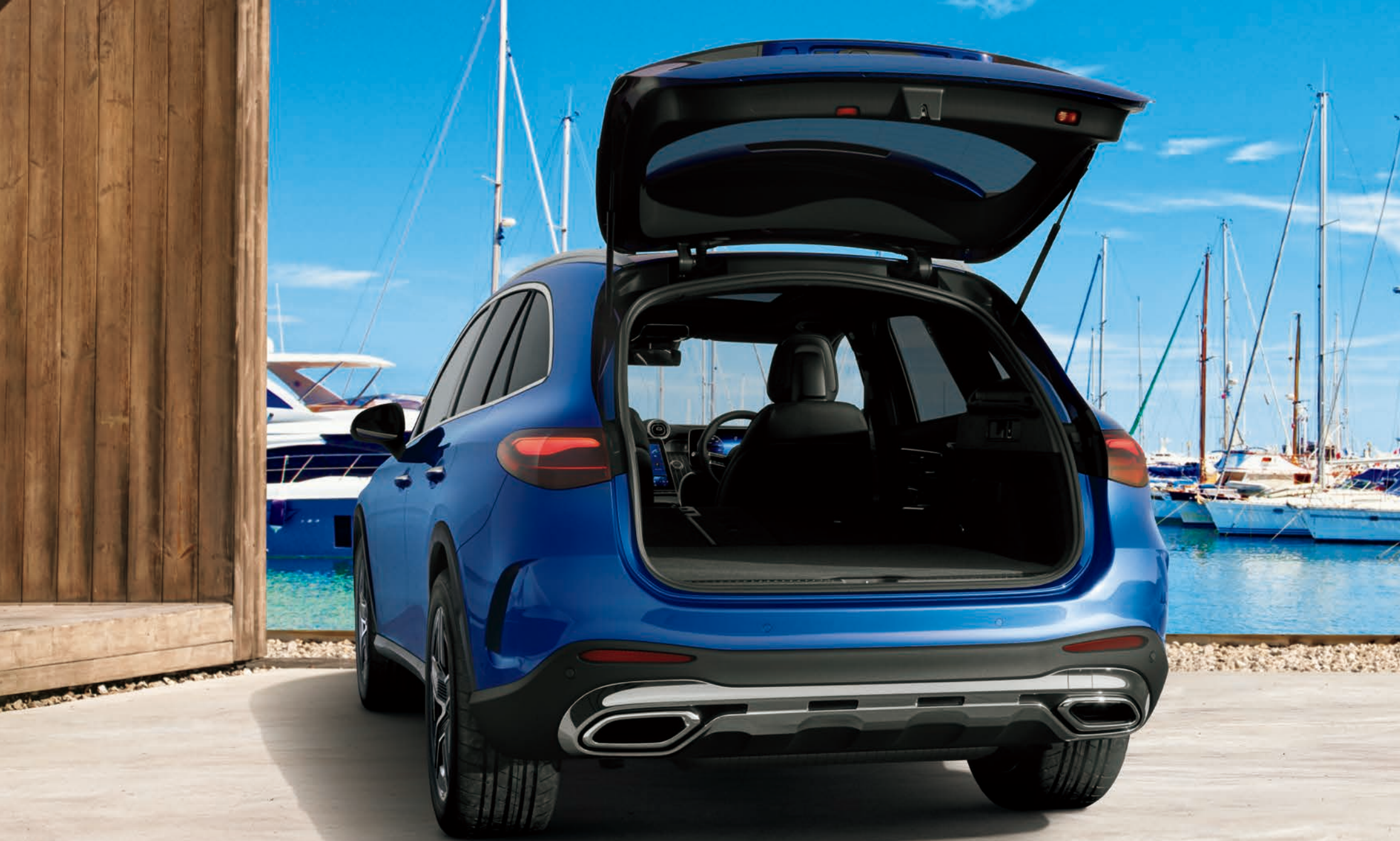
GLC 220 d 4MATIC (ISG搭載モデル)

ボディカラー: スペクトラルブルー(メタリックペイント)(有償オプション) 主要オプション: AMGラインパッケージ(有償オプション)