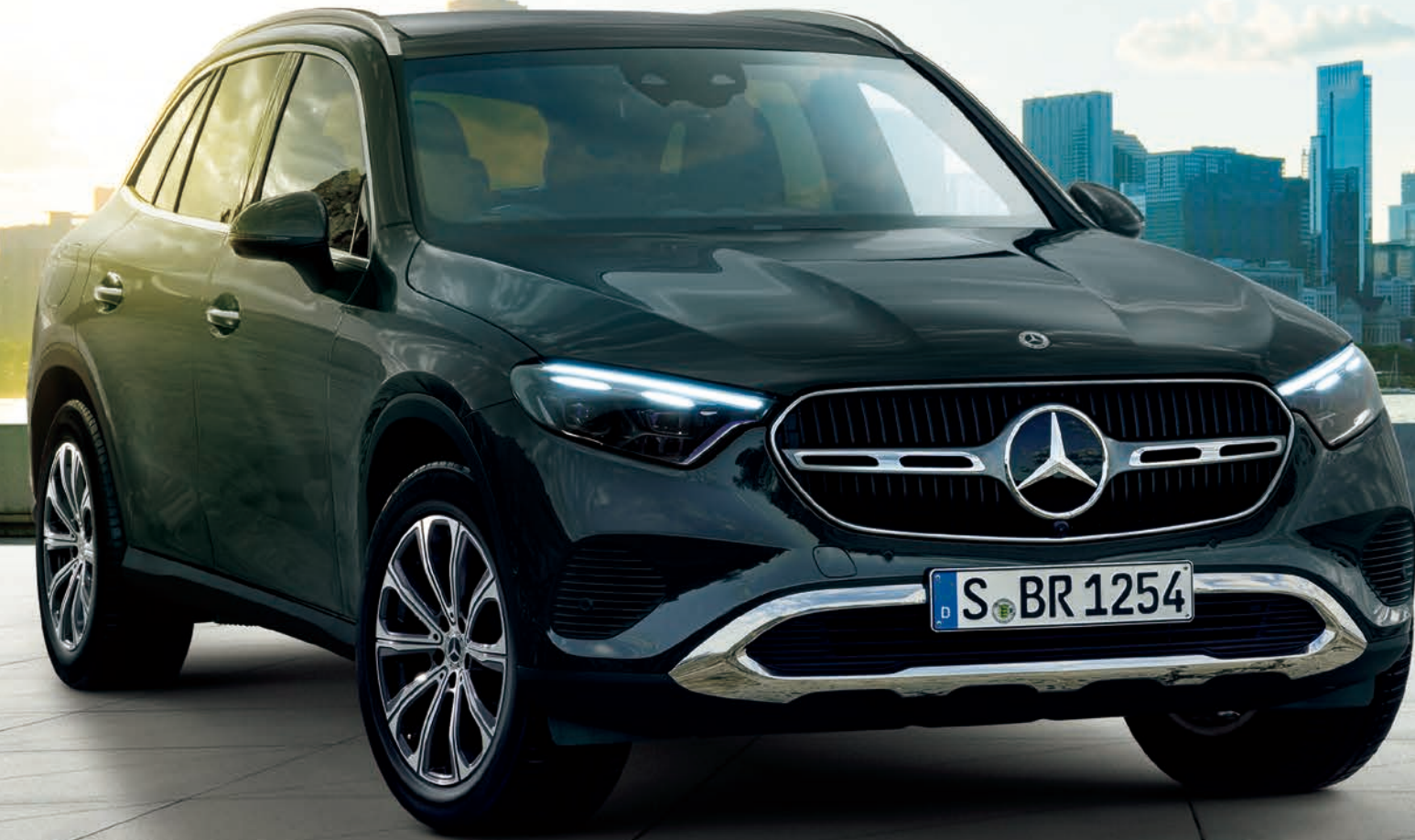
GLC 220 d 4MATIC (ISG*搭載モデル)

ボディカラー: オプシディアンブラック(メタリックペイント)(有償オプション) 主要オプション: パノラミックスライディングルーフ(有償オプション)