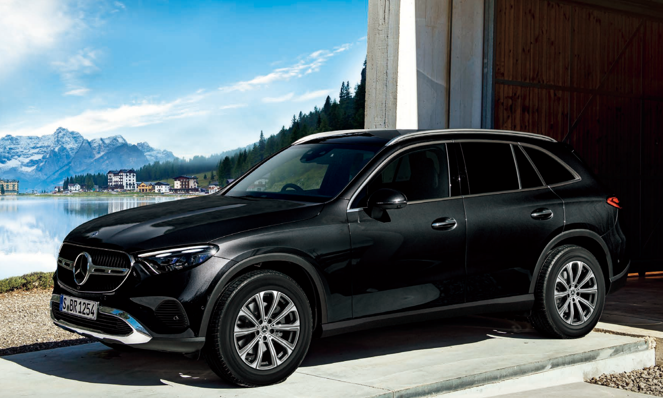
GLC 220 d 4MATIC (ISG搭載モデル)

ボディカラー: オプシアンブラック (メタリックペイント) (有償オプション) 主要オプション: パノラミックスライディングルーフ (有償オプション)