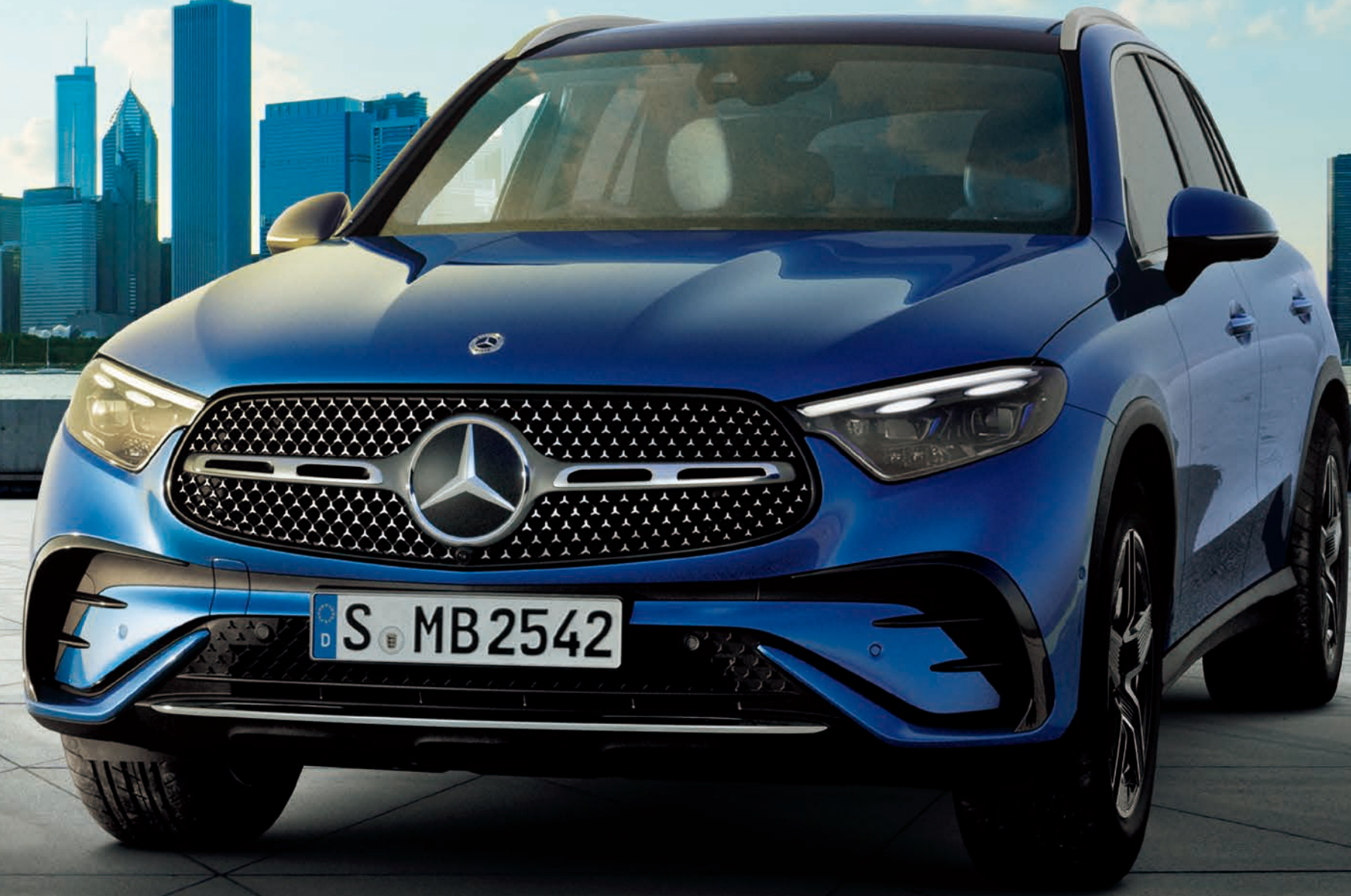
GLC 220 d 4MATIC (ISG搭載モデル)

ボディカラー: スペクトラルブルー(メタリックペイント)(有償オプション) 主要オプション: AMGラインパッケージ(有償オプション)、パノラミックスライディングルーフ(有償オプション)