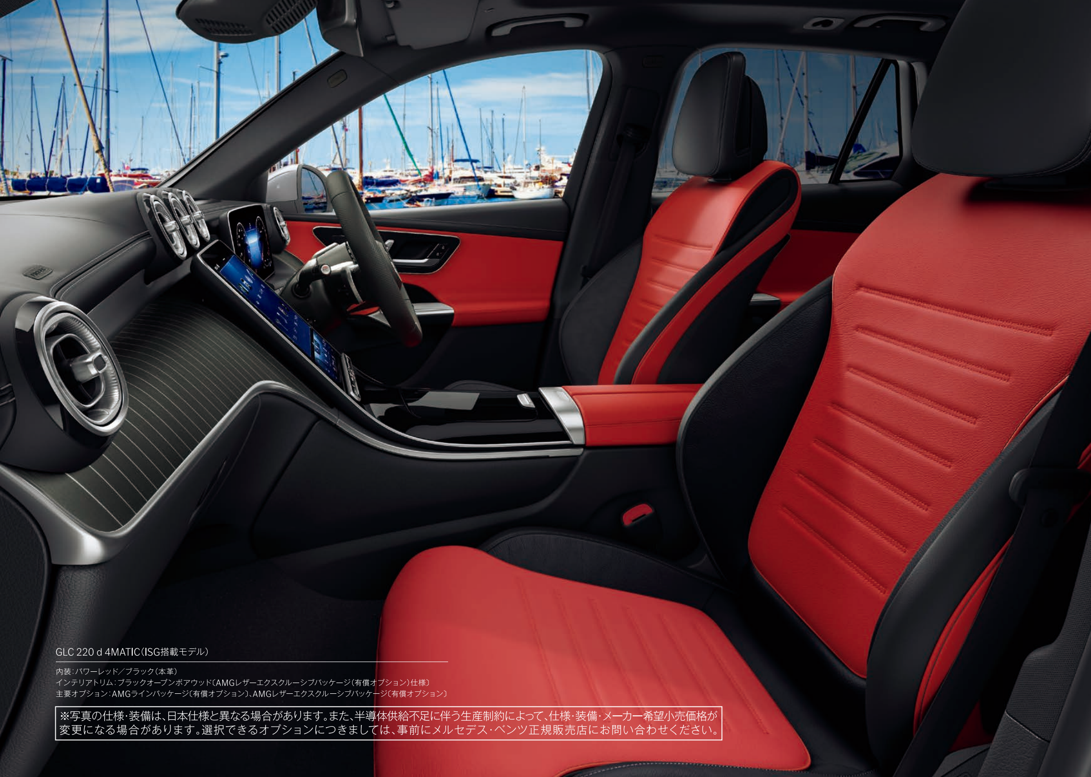
GLC 220 d 4MATIC (ISG搭載モデル)

内装: パワーレッド/ブラック (本革) インテリアトリム: ブラックオープンポアウッド (AMGレザーエクスクルーシブパッケージ (有償オプション) 仕様) 主要オプション: AMGラインパッケージ (有償オプション)、AMGレザーエクスクルーシブパッケージ (有償オプション)