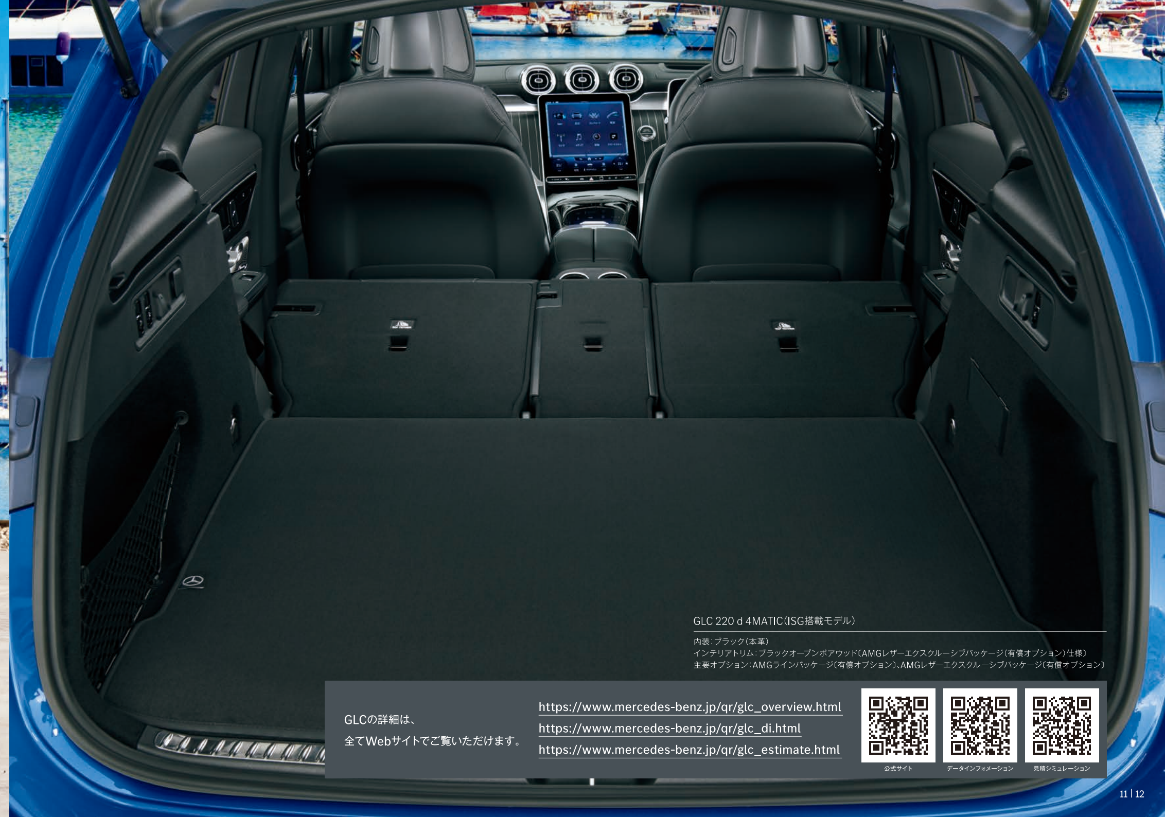
GLC 220 d 4MATIC (ISG搭載モデル)

※写真の仕様・装備は、日本仕様と異なる場合があります。また、半導体供給不足に伴う生産制約によって、仕様・装備・メーカー希望小売価格が変更になる場合があります。選択できるオプションにつきましては、事前にメルセデス・ベンツ正規販売店にお問い合わせください。