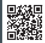
見積シミュレーション