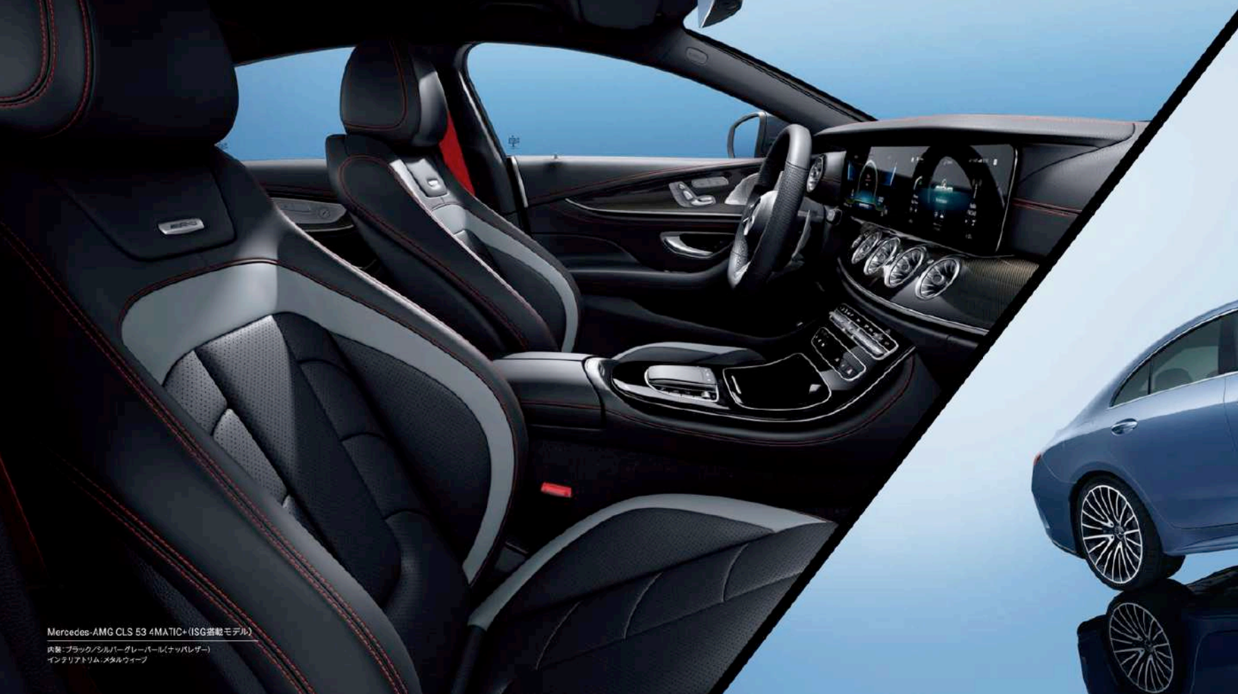
Mercedes-AMG CLS 53 4MATIC+ (ISG搭載モデル)

内装：ブラック/シルバーグレーパール(ナッパレザー) インテリアトリム：メタルフィニッシュ