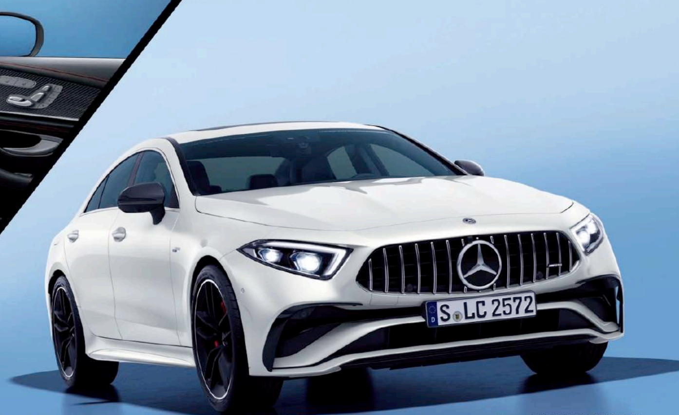
Mercedes-AMG CLS 53 4MATIC+ (ISG搭載モデル)

内装：ブラック(ナッパレザー、レッドステッチ入) インテリアトリム：AMGカーボン (オプション装着車)