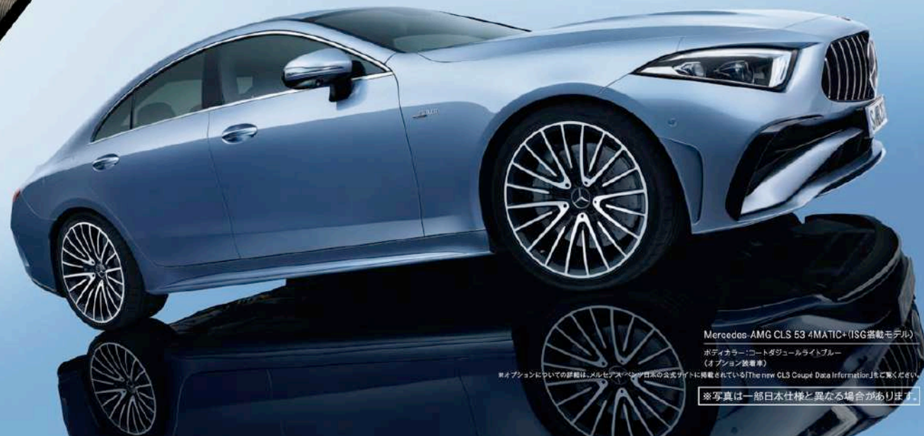
Mercedes-AMG CLS 53 4MATIC+ (ISG搭載モデル)

モータースポーツの輝かしい歴史を受け継ぐAMG専用グリル、迫力の開口部をもつAウイングデザインのフロントエプロン、 ボンネットにあしらわれたパワードーム、鋭くスタイリッシュなデザインのLEDヘッドライトをレイアウト。 それは、力強い躍動感が満ちる、胸高鳴るハイパフォーマンスのためのスタイル。