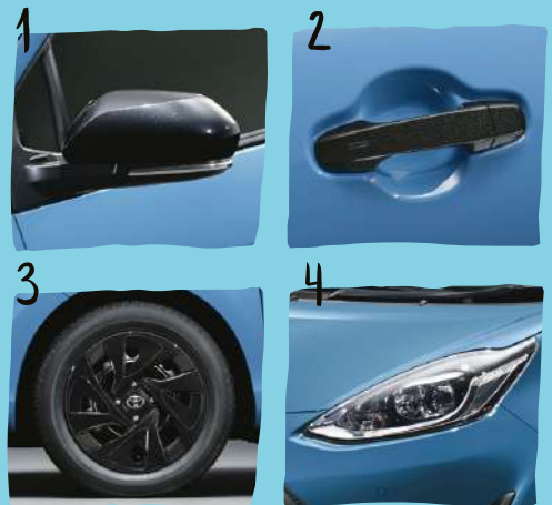
1 ドアミラーカバー (ブラック加飾)