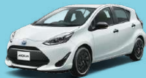
ホワイトパールクリスタルシャイン(070) メーカーオプション※