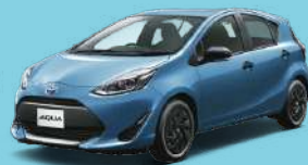
グレイッシュブルー(8W2) 特別設定色