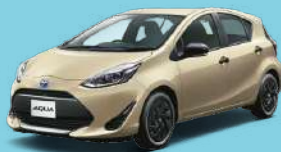
ベージュ(4U0) 特別設定色