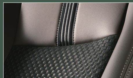
① 専用シート表皮 [合成皮革(ダークブラウン)+ ファブリック(ブラウンブラック+ブラウンステッチ)、リボン加飾(ブラウン)]