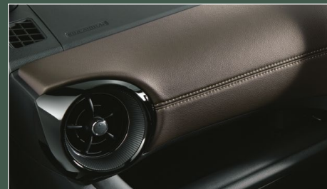
③ インパネ助手席オーナメント(合成皮革巻き) (ダークブラウン+ブラウンステッチ)