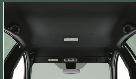
④ ブラックインテリア (ルーフ、ピラー、アシストグリップ、サンバイザー)