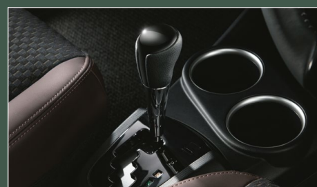
② シフトノブ (上部ブラック加飾)