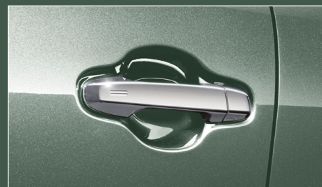
⑤ メッキアウトサイドドアハンドル