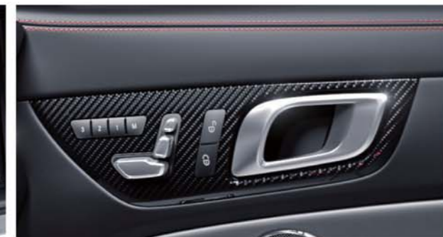
AMGカーボンインテリアトリム

ダイナミックなハンドリングと快適性を両立する専用サスペンション。軽量かつ高い剛性の「AMG RIDE CONTROLスポーツサスペンション」を搭載。AMGダイナミックセレクトで選択できる3つのモードと連動し、走行状況に応じて四輪それぞれを電子制御します。サーキットなどでのダイナミックなドライビングと、街中や長距離移動時の快適性を高い次元で両立します。