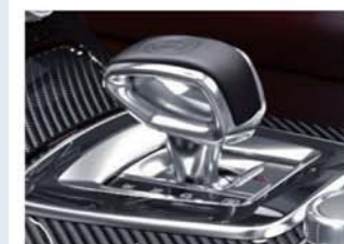
AMG E-SELECTレバー (AMGエンボス入)