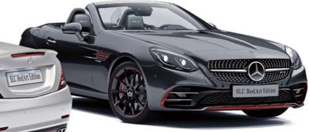
ボディカラー: オブシディアンブラック (メタリック)