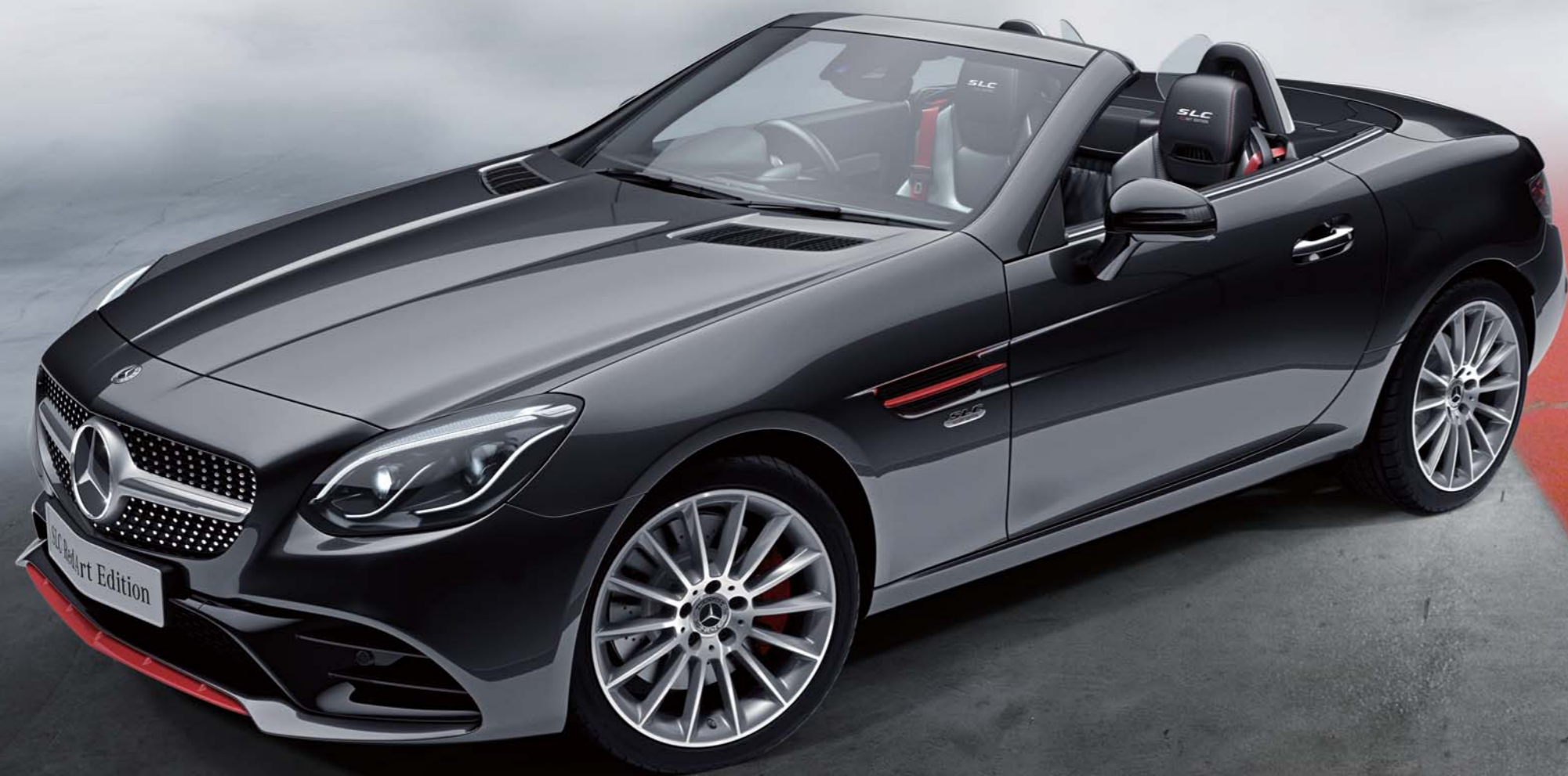
SLC 180 Sports RedArt Edition

上質なオープンドライブを愉しめるSLCに、スポーティネスあふれる限定モデルが登場。 白と黒の2色から選択できるボディに、フロントやサイドなど随所にスポーティなレッドアクセントをあしらひ、 赤のブレーキキャリパーや専用ホイールを装備。 走りへの情熱を刺激するカーボンパターンエンボスが施された室内には、 “SLC REDART EDITION”の刺繍入りのツートンナッパレザーシートを採用。 高揚感あふれるオープンドライブのため、革新のロードスターは走りの精神を宿した。