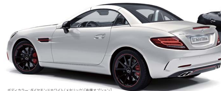
ボディカラー: ダイヤモンドホワイト (メタリック) [有償オプション]

特別装備以外の装備は、Mercedes-AMG SLC 43に準じます。 標準装備につきましては、SLCのカタログをご覧ください。