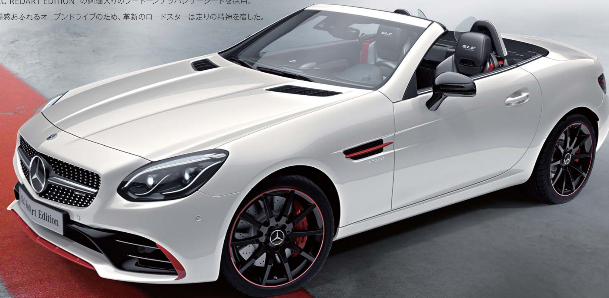
Mercedes-AMG SLC 43 RedArt Edition

上質なオープンドライブを愉しめるSLCに、スポーティネスあふれる限定モデルが登場。 白と黒の2色から選択できるボディに、フロントやサイドなど随所にスポーティなレッドアクセントをあしらひ、 赤のブレーキキャリパーや専用ホイールを装備。 走りへの情熱を刺激するカーボンパターンエンボスが施された室内には、 “SLC REDART EDITION”の刺繍入りのツートンナッパレザーシートを採用。 高揚感あふれるオープンドライブのため、革新のロードスターは走りの精神を宿した。