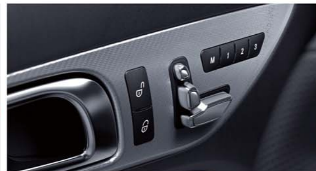
カーボンデザインアルミニウムインテリアトリム

寒いときでもオープンエアドライブが楽しめる「エアスカート」シートバックに内蔵した超小型セラミックヒーターによって暖めた空気を、ヘッドレスト下部から吹き出して乗員の首まわりを暖める機構。風量は3段階に切り替えられるほか、外気温や走行速度に応じて最適に電子制御されます。