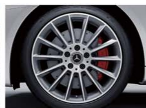
RedArt Edition専用 18インチAMGマルチスポークアルミホイール