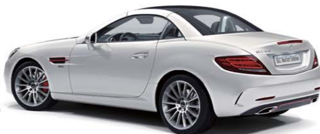
ボディカラー: ダイヤモンドホワイト (メタリック) [有償オプション]