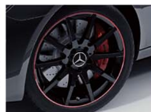
RedArt Edition専用ハイグロスブラックペイント 18インチAMG10スポークアルミホイール