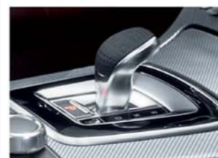
ダイレクトセレクトレバー (カーボンパターンエンボス入レザー)