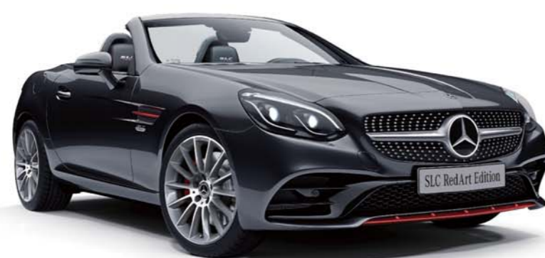
ボディカラー: オブシディアンブラック (メタリック)