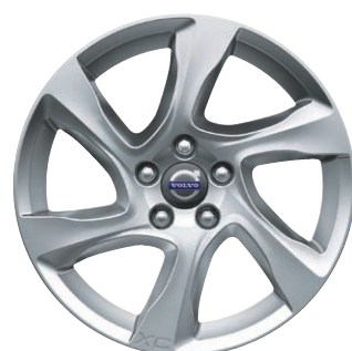
専用アルミホイール"Larenta"(シルバー)