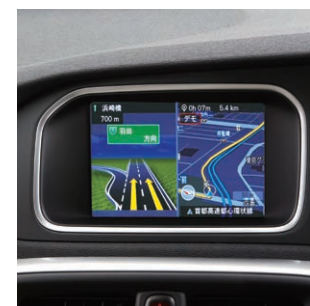
RTI:HDDナビゲーションシステム