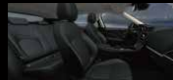
エボニー (エボニーステッチ) (SEC)