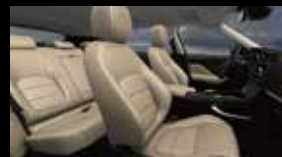
ラテ (エスプレッソステッチ) (TZE)