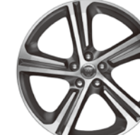
20インチ5スポーク "スタイル5035" (グレイ、ダイヤモンドターンド フィニッシュ)