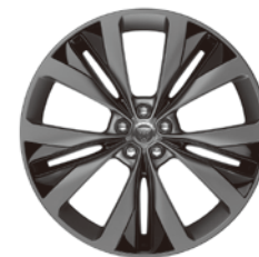
22インチ15スポーク "スタイル1020" (グレイフィニッシュ& コントラストインサート)