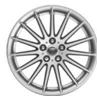
18インチ15スポーク "スタイル1022"