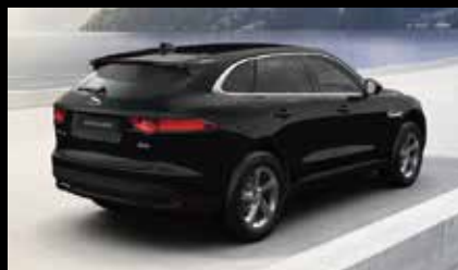
グレイレザーシート (O33AS)