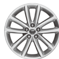
18インチ10スポーク "スタイル1018"