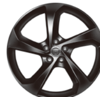
19インチ5スポーク "スタイル5037" (グロスブラックフィニッシュ)