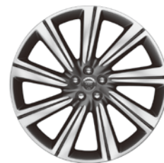
22インチ9スポーク "スタイル9006" (グレイ、ダイヤモンドターンド フィニッシュ)