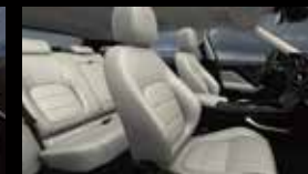
ライトオイスター (ビスタチオステッチ) (SEF)