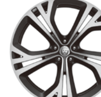
21インチ5スプリットスポーク "スタイル5080" (ダイヤモンドターンド フィニッシュ)