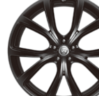
22インチ5スプリットスポーク "スタイル5081" (グロスブラックフィニッシュ)