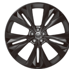
22インチ15スポーク "スタイル1020" (グロスブラックフィニッシュ& サテンブラックインサート)