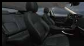
エボニー (シエナタンステッチ) (SEE)