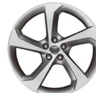
19インチ5スポーク "スタイル5037"