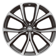
22インチ5スプリットスポーク "スタイル5081" (ダイヤモンドターンド フィニッシュ)