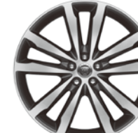
20インチ5スプリットスポーク "スタイル5031" (グレイ、ダイヤモンドターンド フィニッシュ)