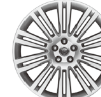
20インチ10スプリットスポーク "スタイル1019"