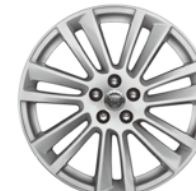
19インチ7スプリットスポーク "スタイル7012"