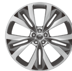
22インチ15スポーク "スタイル1020" (コントラストインサート)