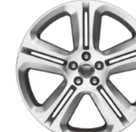
20インチ5スプリットスポーク "スタイル5036"