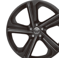
20インチ5スプリットスポーク "スタイル5035" (グロスブラックターンド フィニッシュ)