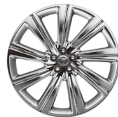
22インチ9スポーク "スタイル9006" (クロームフィニッシュ)