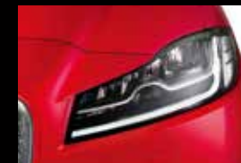
(O64GJ) PRESTIGE セレクトパックに採用