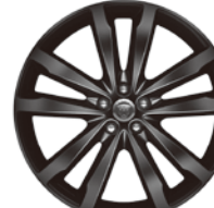
20インチ5スプリットスポーク "スタイル5031" (グロスブラックフィニッシュ)