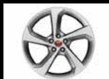
19インチ5スポーク"スタイル5037" アロイホイール (O29YK)