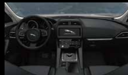
ラックステックシート (O33YD)