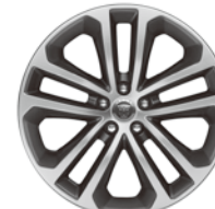
19インチ5スプリットスポーク "スタイル5038" (グレイ、ダイヤモンドターンド フィニッシュ)