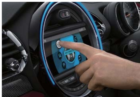
8.8インチ・ワイド・カラー・ディスプレイ 視認性の良いワイド・スクリーンに、操作性に優れた タッチ・パネルを装備。