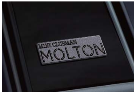
MINI Clubman Molton 専用ネーム・バッジ 日本にしかない限定車の証が、リア・ピラーに。