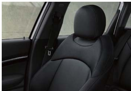
MINI Clubman Molton 専用レザレット・シート カーボン・ブラック 上質感漂うレザレット・シートが、シックな室内空間を演出。