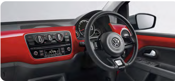
ダッシュボード:レッド/ダッシュボード:アンスラサイト