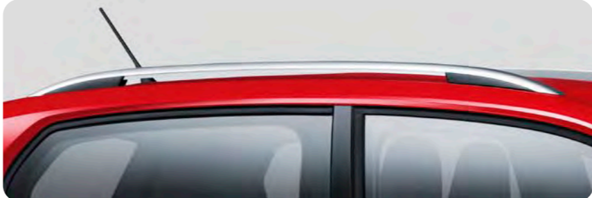
シルバールーフレール