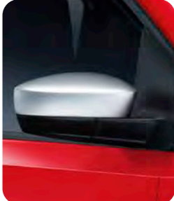
シルバードアミラー