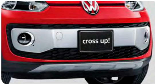
シルバーフロントバンパー