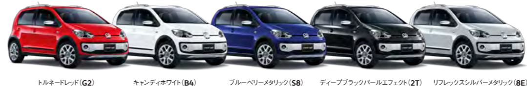
トルネードレッド(G2) キャンディホワイト(B4) ブルーベリーメタリック(S8) ディーブブラックパールエフェクト(2T) リフレックスシルバーメタリック(8E)