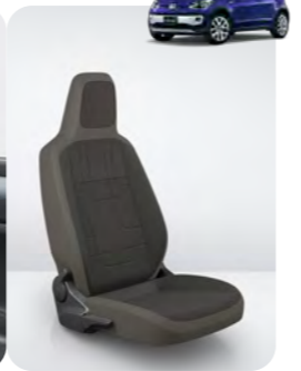
シートカラー:アンスラサイト/グレー(JO)