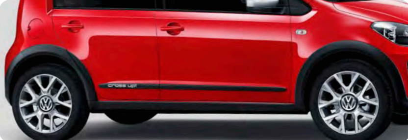
ホイールハウスエクステンション/ブラックサイドモールディング