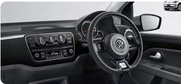
ダッシュボード:ブラックパール/ダッシュボード:アンスラサイト