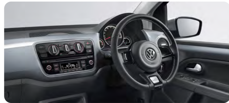
ダッシュボード:ダークシルバー/ダッシュボード:アンスラサイト