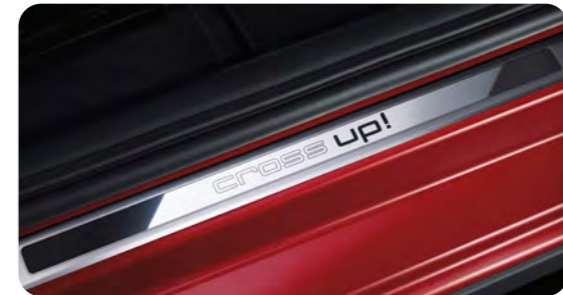
ドアシルプレート