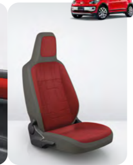
シートカラー:レッド/グレー(JC)