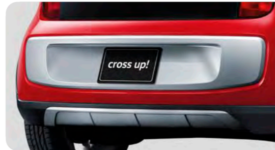
シルバーリアバンパー