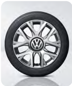
16インチアルミホイール