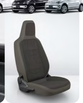
シートカラー:アンスラサイト/グレー(JO)