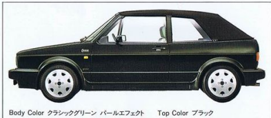
Body Color クラシックグリーン パールエフェクト Top Color ブラック