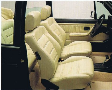
ゴルフ カブリオ「クラシック ライン」オリジナルカラー

愛知県豊橋市明海町5-10 〒441 お客様相談窓口 フリーダイヤル 0120-308460