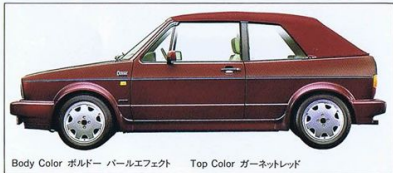
Body Color ボルドー パールエフェクト Top Color ガーネットレッド

※ボディカラー及びシートカラーは印刷仕様の員会で実際の色と多少違って見えますのでご了承ください。