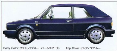
Body Color クラシックブルー パールエフェクト Top Color インディゴブルー