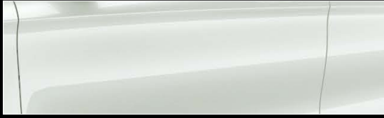
■ボディカラー：カルサイトホワイト