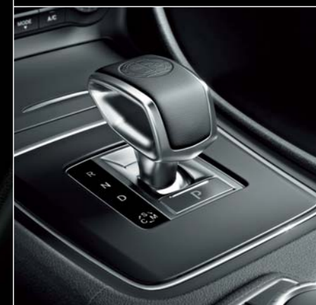
AMGエンブレム付AMG E-SELECTレバー ※写真は欧州仕様車です。