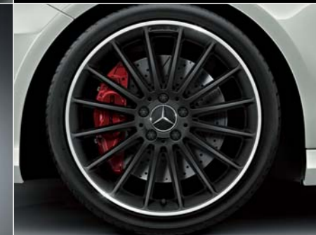
マットブラックペイント 19インチAMGマルチスポークアルミホイール