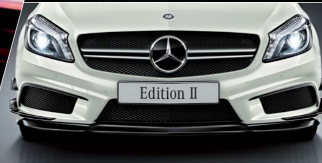
Edition II専用エアロパーツ[フリック]&ハイグロスブラックパーツ[フロントスポイラーリップ]&ツインルーバーシルバークロームフロントグリル