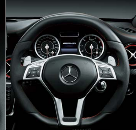
AMGパフォーマンスステアリング (本革/アルカンターラ®)