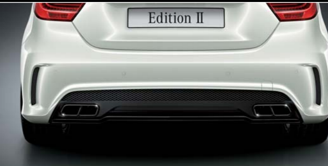
ハイグロスブラックパーツ[デュアルツインクロームエグゾーストエンド]