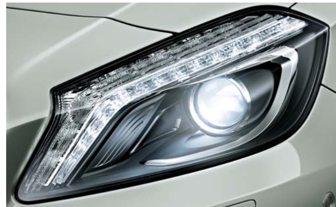
バイキセノンヘッドライト&ヘッドライトウォッシャー