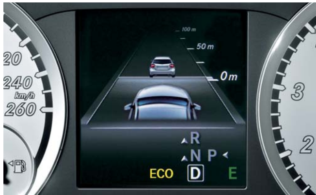
ディストロニック・プラス