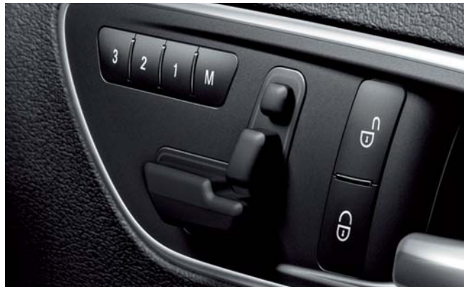
メモリー付フルパワーシート [運転席]

※特別装備以外の装備は、「A 180」に準じます。標準装備につきましては、Aクラスのカタログをご覧ください。