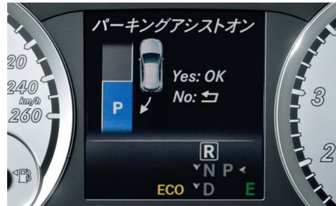
アクティブパーキングアシスト