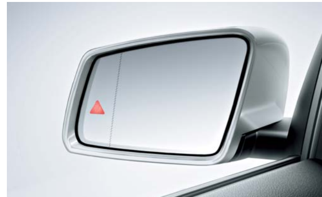
ブラインドスポットアシスト