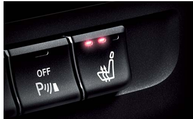
シートヒーター [前席]