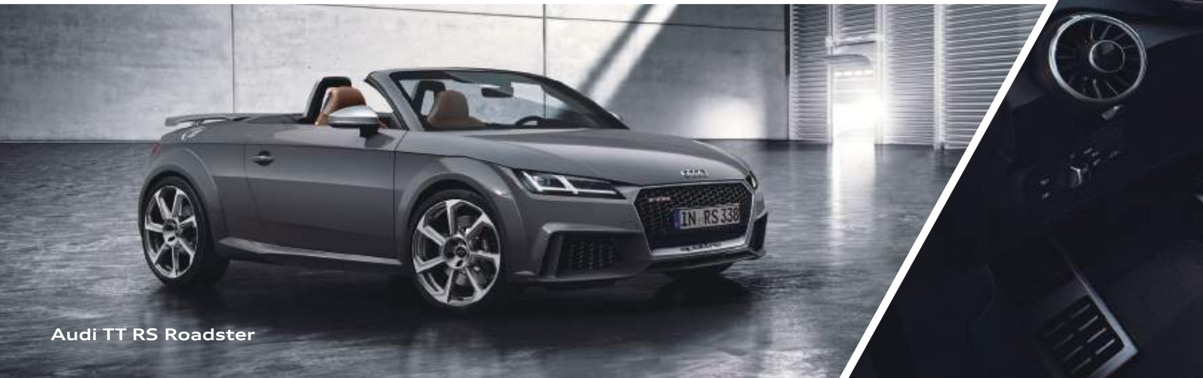
Audi TT RS Roadster