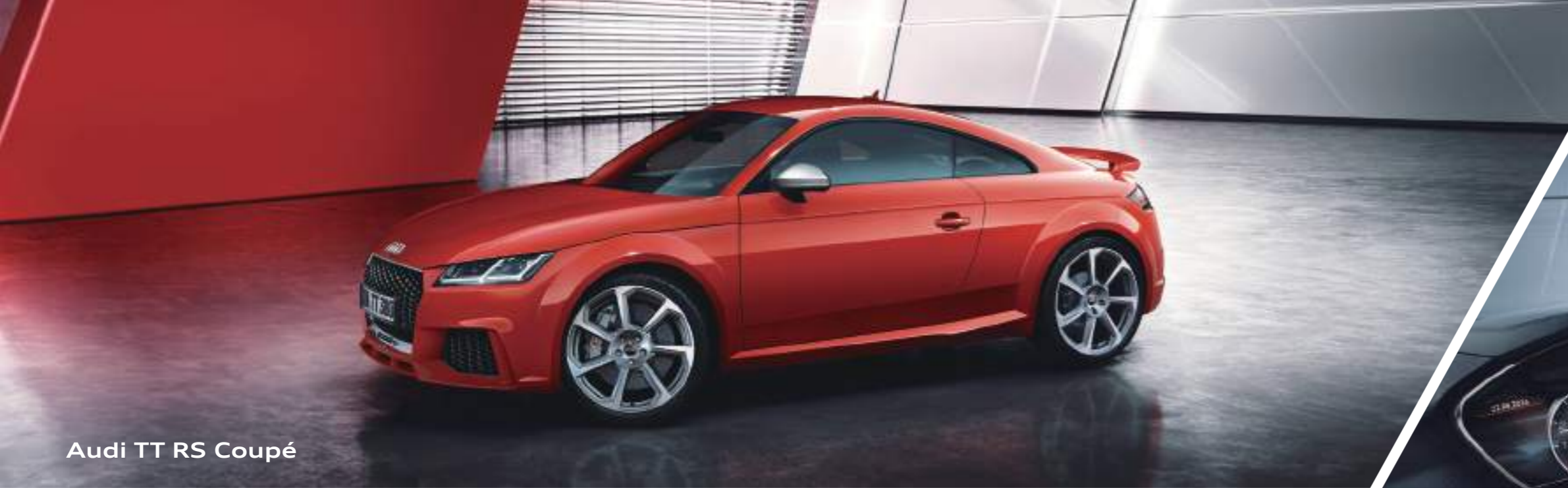
Audi TT RS Coupé